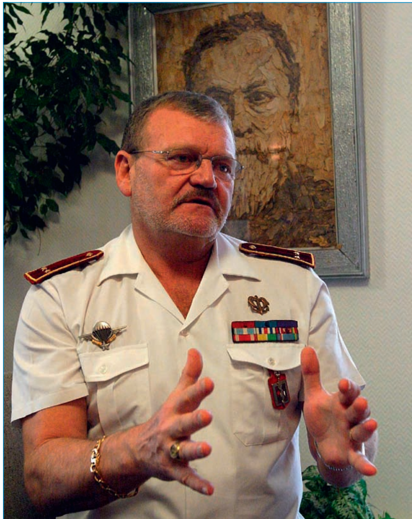
Figure 6. Médecin général Alain Georges (deux étoiles), directeur de l'hôpital d'instruction des armées Legouest, Metz, 2001.

Figure 6. Physician general Alain Georges (two stars), director of the Legouest Army teaching hospital, Metz, 2001.