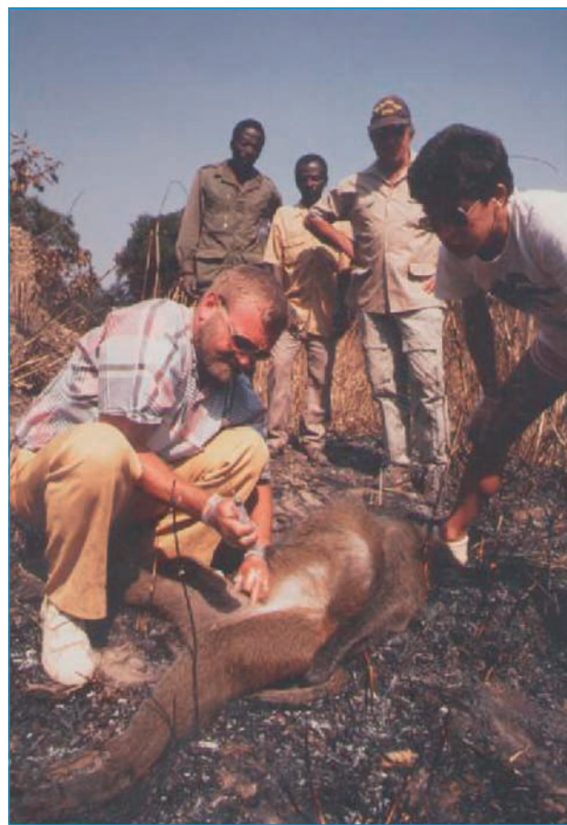
Figure 4. « Chasseur de virus », sur la piste des rétrovirus simiens, savane arborée centrafricaine, 1988.

Figure 4. Virus hunter tracking simian retroviruses, forest-savanna mosaic of the Central African Republic, 1988.