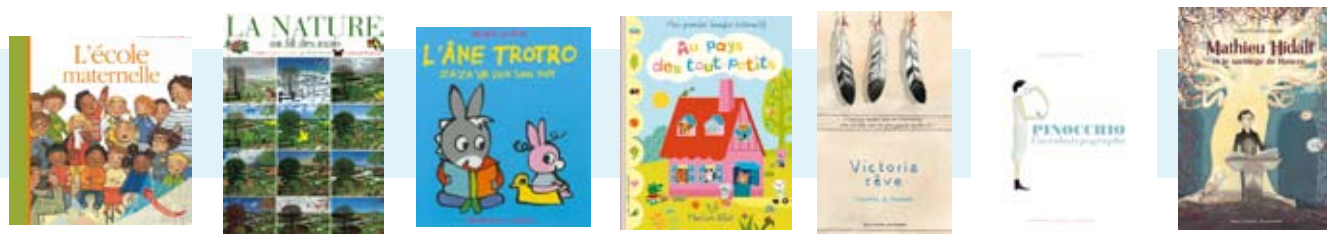
Ouvrages des auteurs Gallimard Jeunesse présents au Festival