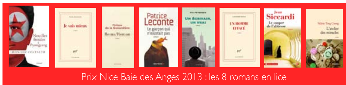
Prix Nice Baie des Anges 2013 : les 8 romans en lice

Pour F-O Giesbert : « C'est un prix qui existe et qui excite les convoitises, il bénéficie d'un très beau palmarès et a fini par s'imposer, tout comme le festival littéraire qui le porte. »