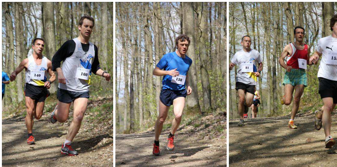
Des garçons qui souffrent