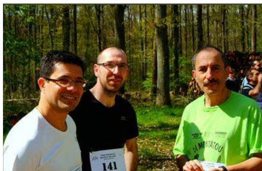
Un petit clin d'œil