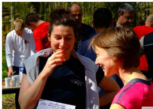
Des filles qui s'éclatent