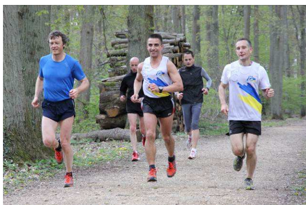
Que de la frime...