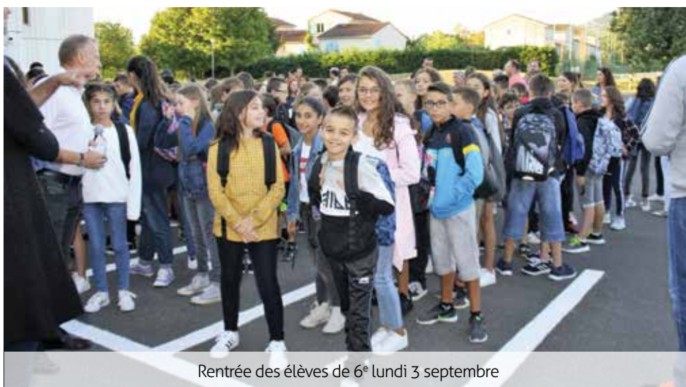
Rentrée des élèves de 6 e lundi 3 septembre

Un dispositif d'accompagnement aux enfants du voyage concerne quelques