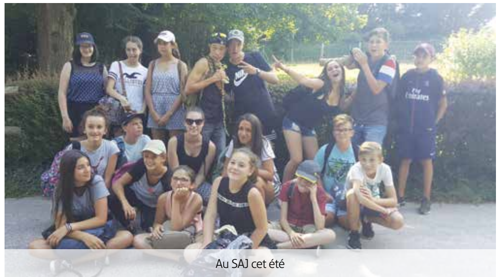
Au SAJ cet été