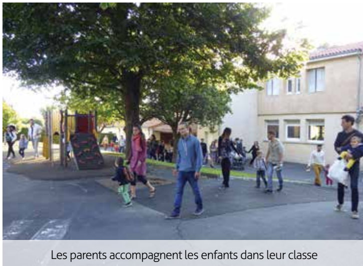
Les parents accompagnent les enfants dans leur classe