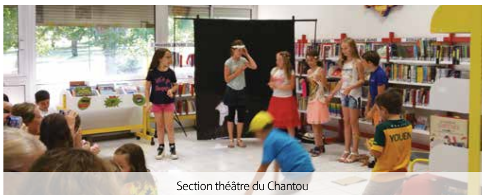
Section théâtre du Chantou