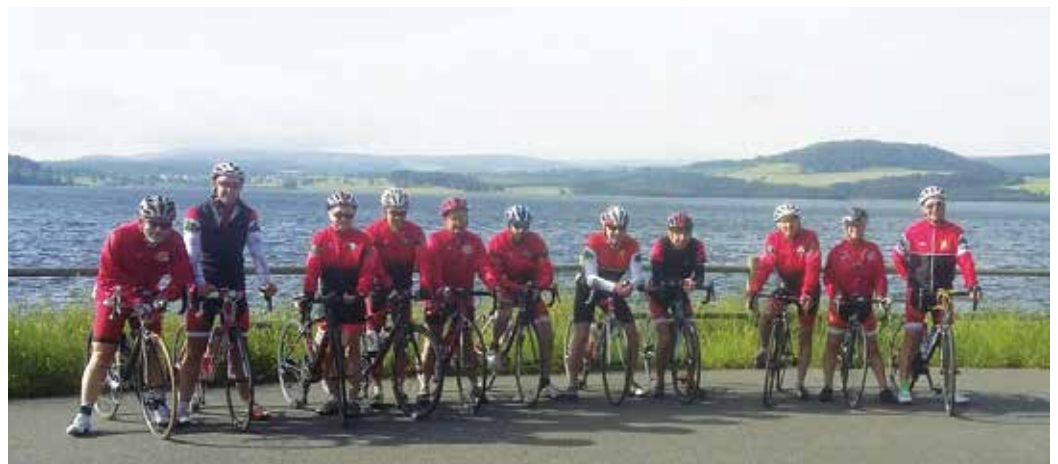
Sortie du club en Lozère