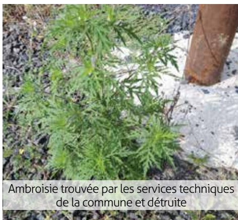
Ambroisie trouvée par les services techniques de la commune et détruite

■