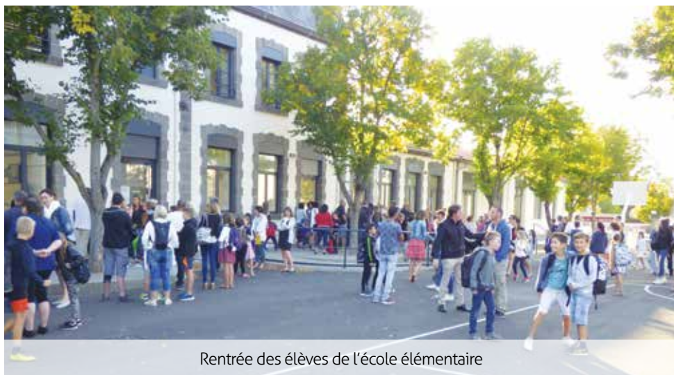
Rentrée des élèves de l'école élémentaire

Comme à l'école maternelle, des travaux sur l'alarme de l'annexe de l'école élémentaire ont été réalisés. ■