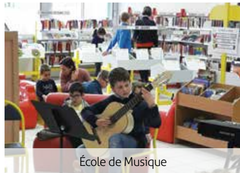
École de Musique