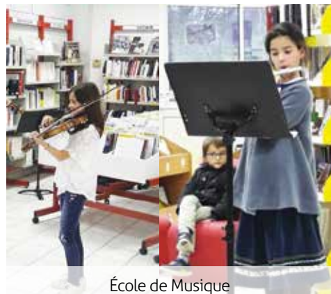
École de Musique