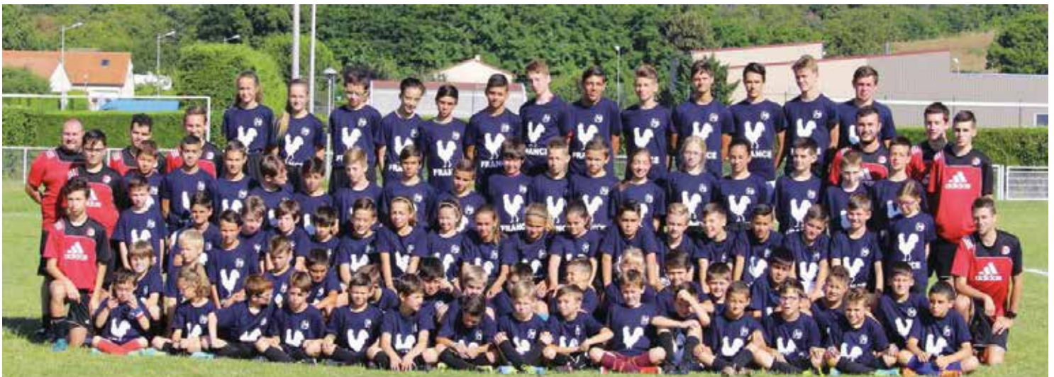
Ils étaient 80 stagiaires à la session d'été qui s'est déroulée au stade Emile-Rive, du 9 au 13 juillet.

Il se déroulera le samedi 17 novembre (ouverture des portes à 19h30), salle des fêtes de la commune, et sera doté de nombreux lots de valeur. ■