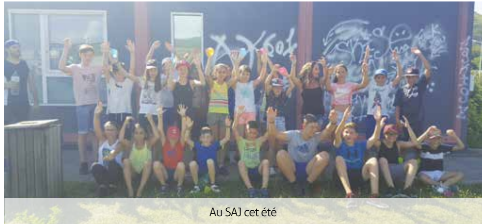
Au SAJ cet été

Le Festival de création de jeux de société lance sa 9 e partie les 17 et 18 novembre 2018, pour le plus grand bonheur des amateurs de jeux. Pendant tout un week-end, des créateurs venus de toute la France, se réunissent à l'espace Léo-Lagrange de La Roche-Blanche afin de partager leur passion. C'est l'occasion pour eux de vous faire découvrir leurs créations et vous faire passer un bon moment. ■