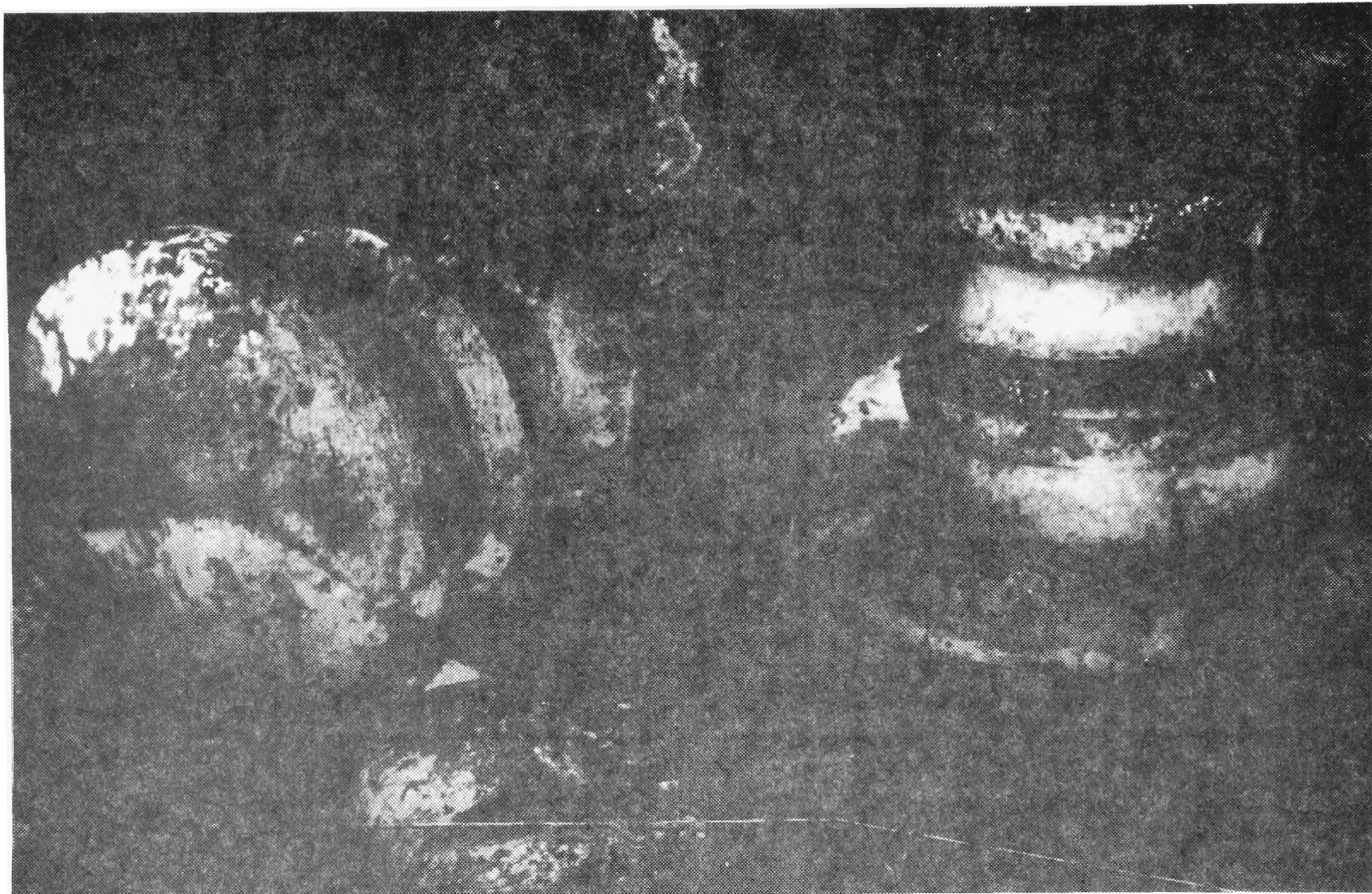
Fig. 4. Urnes funéraires de Trou Biche telle qu'elles ont été découvertes en Mai 1985 par H.petitjean Roget et M. Sébélou