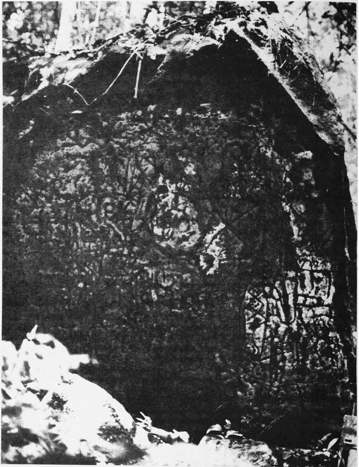
Fig. 3. Roche gravée de Kaw: Les grafures sont révélées par la peinture à la gouache appliquée au rouleau sur la surface de la roche Cliché R. Robinot.