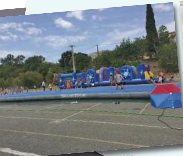
Jeux gonflables pour tous