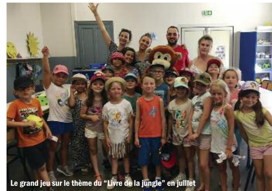
Le grand jeu sur le thème du "Livre de la jungle" en juillet