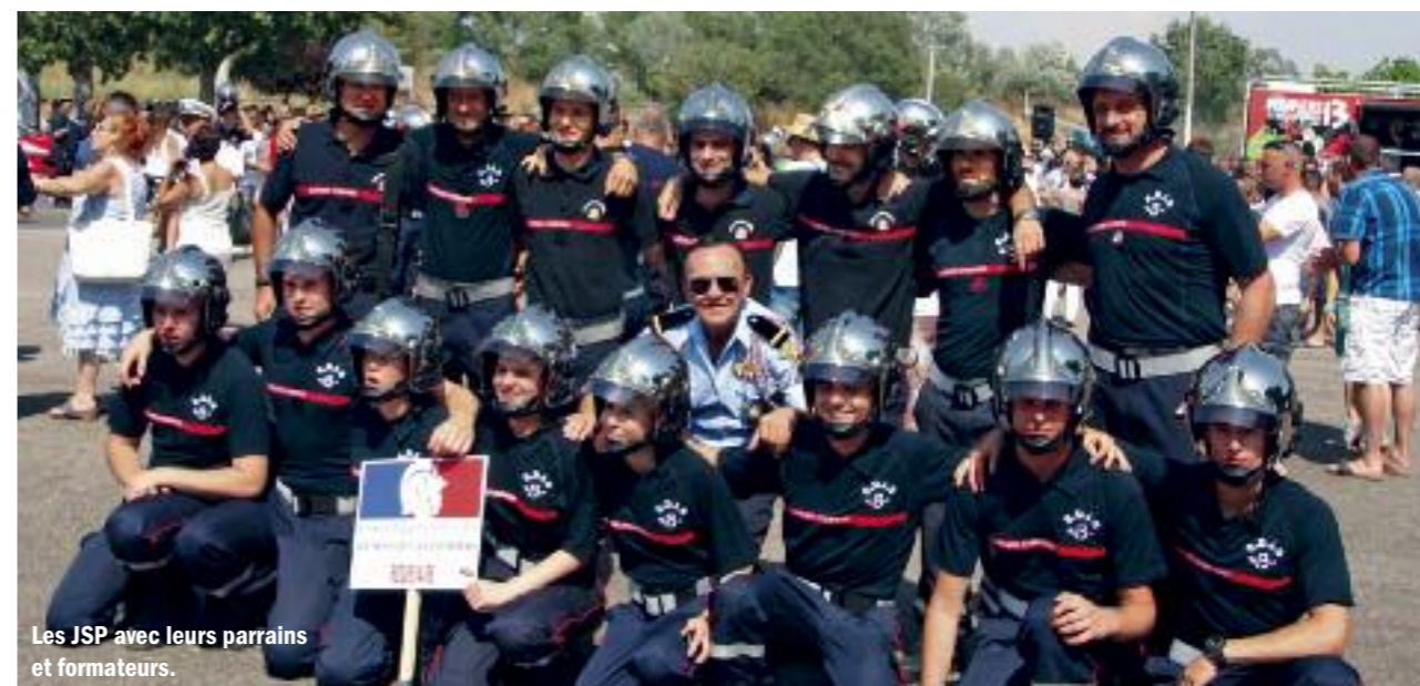
Les JSP avec leurs parrains et formateurs.

Conscients de ce qui les attend, ils seront en mesure de mener à bien leurs missions au service de la population et de transmettre aussi leur savoir à la relève de demain !