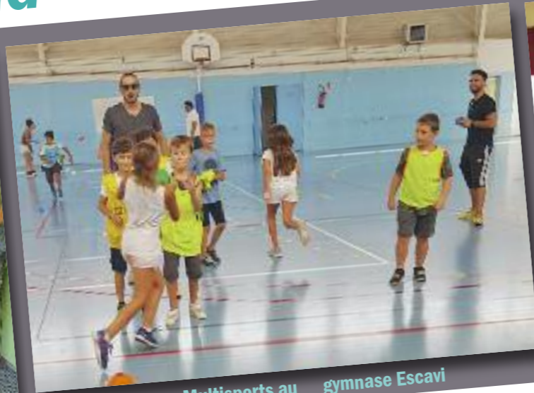
Multisports au gymnase Escavi