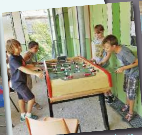
Seance de babyfoot au secteur jeunes