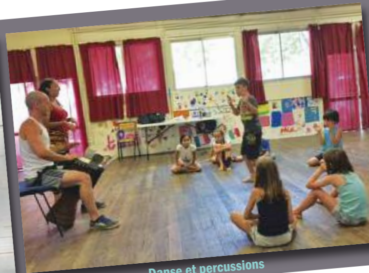
Danse et percussions