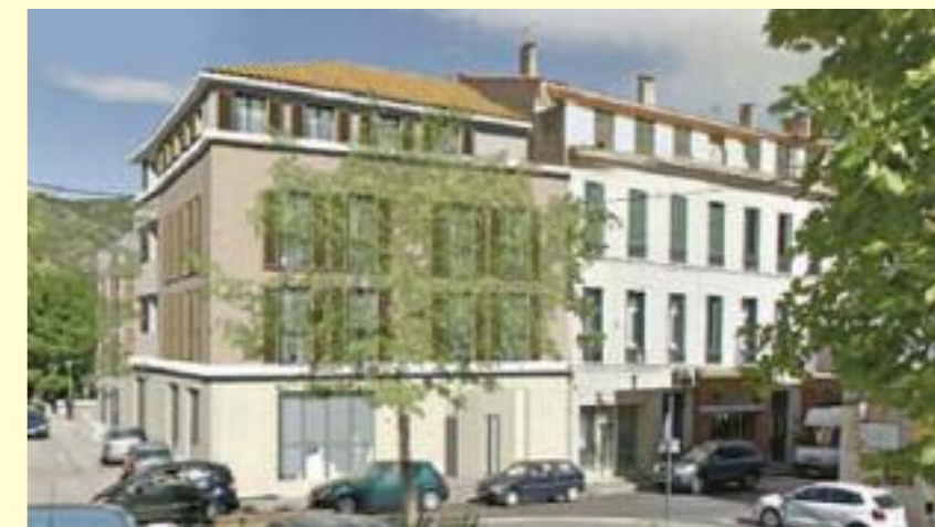
Le projet de construction de l'ancienne Câprerie vu sous l'angle de la rue du Dr Gariel - Avenue des Alliés