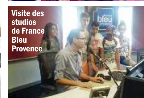
Visite des studios de France Bleu Provence