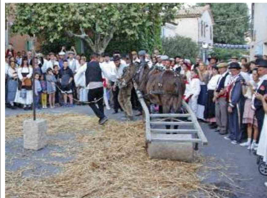
Fête de la Saint-Eloi à Lascours Grande cavalcade haute en couleurs, bals, soirées à thème, course de carrioles version Mario Kart, grand prix cycliste, animations pour les enfants, tous les ingrédients étaient réunis pour une grande réussite de ces réjouissances organisées par le Comité des Fêtes de Lascours. Une année particulière, marquée par 140 ans de Saint-Eloi et célébrés lors d'une soirée spéciale avec défilé en costumes d'époque, danses folkloriques, foulage du blé à l'ancienne.