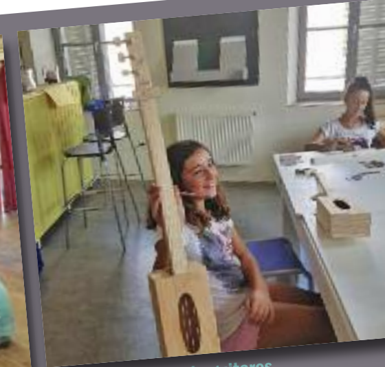
Confection de guitares