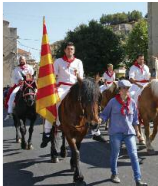
Fête votive de Roquevaire Bals, soirée cabaret, aioli et manèges ont fait le bonheur des parents et des enfants lors de ces 5 jours de fête, magnifiquement orchestrés par le Comité des Festivités de Roquevaire. La très belle cavalcade du 15 août, organisée par la Confrérie St Eloi-St Vincent, a conquis les nombreux Roquevairois et touristes.