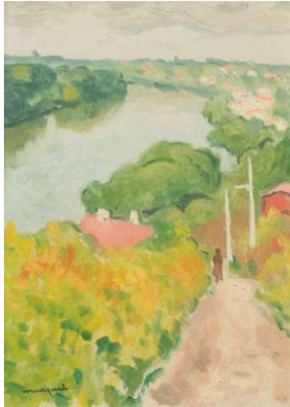
La Seine vue de la Frette, 1945 Huile sur panneau d'isorel, signée en bas à gauche 21,5 x 15 cm 5 000/7 000 € Vendue : 24 400 € - Lot 79