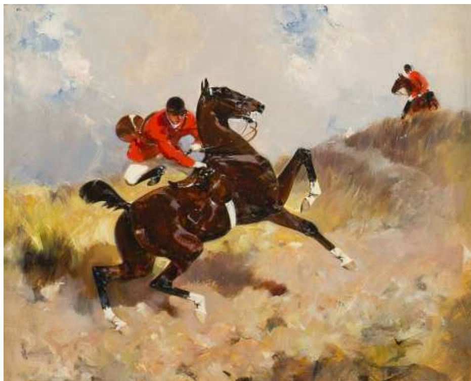
René PRINCETEAU (1843-1914)