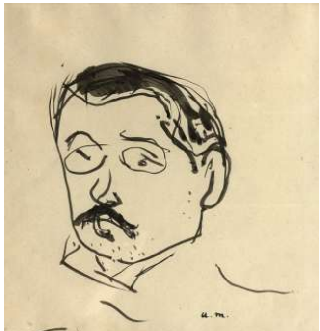
Autoportrait Plume et encre noire 14,7 x 14 cm Monogrammé « a.m » en bas à droite 1 200/1 500 € Vendue : 4 270 € - Lot 78