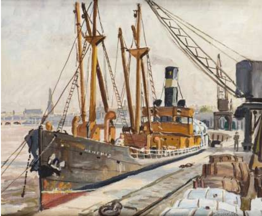
Le Memphis à quai, Bordeaux Huile sur toile, signée en bas à droite, située «Bordeaux» et titrée «Le Memphis» au verso, porte le cachet d'atelier et le n°0104 au verso 38,5 x 46,5 cm 1 000/1 500 € Vendue : 5 125 € - Lot 139

Fond d'atelier de Georges de SONNEVILLE (1889-1978) , d'environ treize tableaux