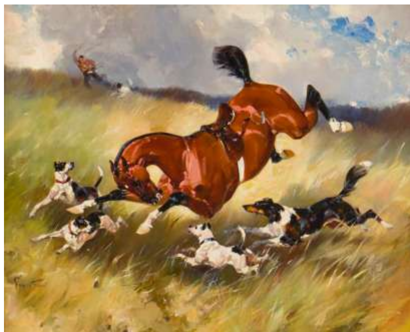
René PRINCETEAU (1843-1914)

Cheval effrayé par des chiens de compagnie