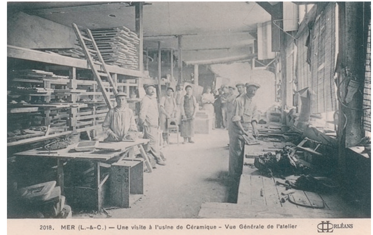
2018. MER (L.-&-C.) — Une visite à l'usine de Céramique - Vue Générale de l'atelier