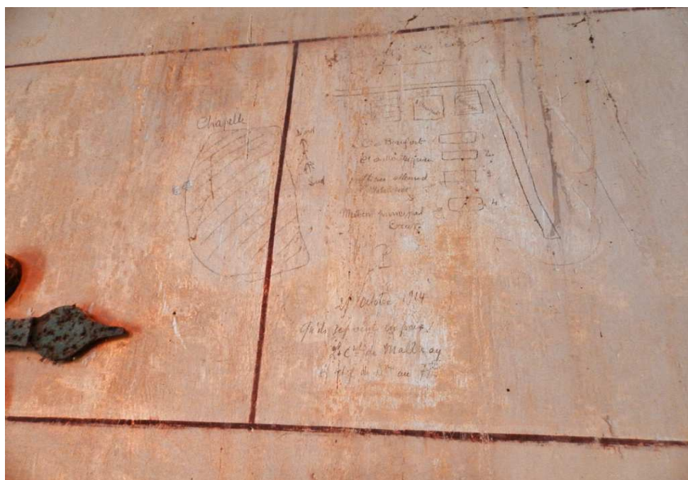
Inscriptions manuscrites sur les murs intérieurs de l'église de Mondement Département de la Marne, 2015