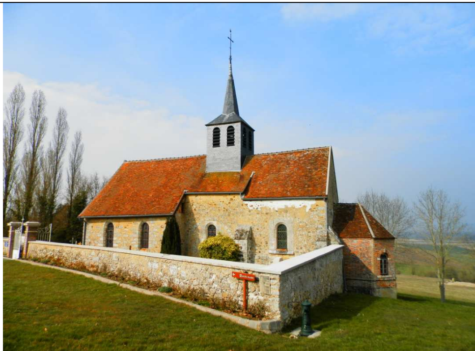
Église de Mondement Département de la Marne, 2015