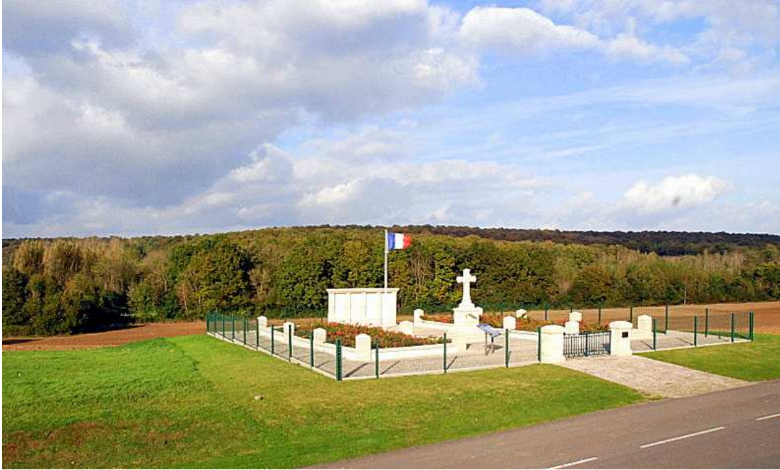
(MA05-i2 Ossuaire de Soizy-aux-Bois Département de la Marne – 2014)