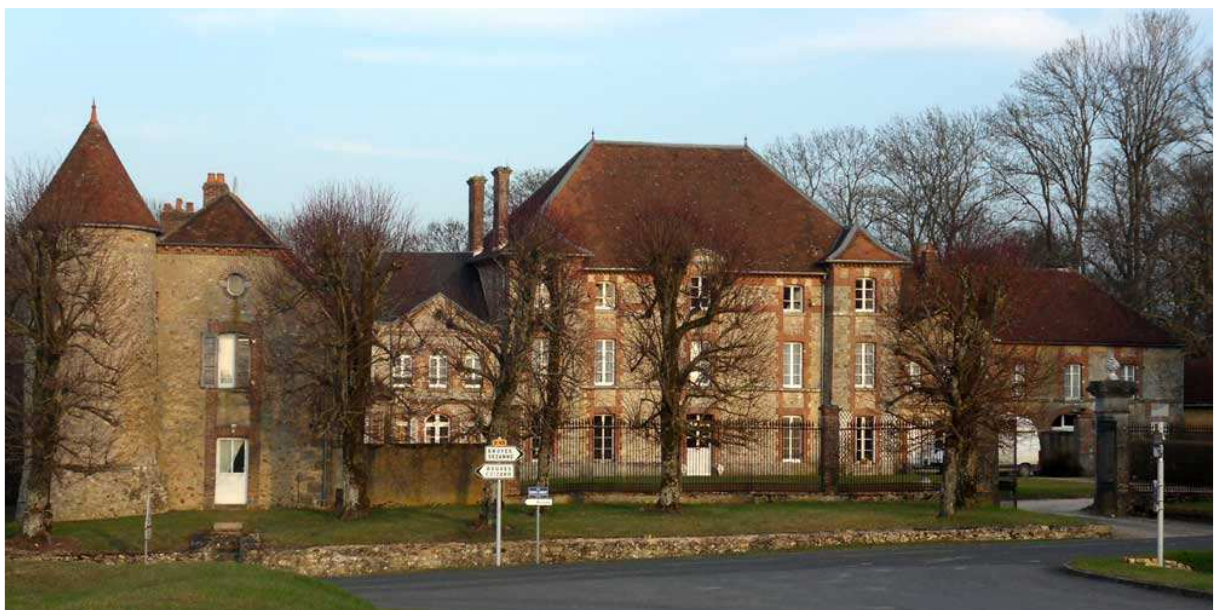
(MA05-t2 – Château de Mondement – Département de la Marne -mars 2012)