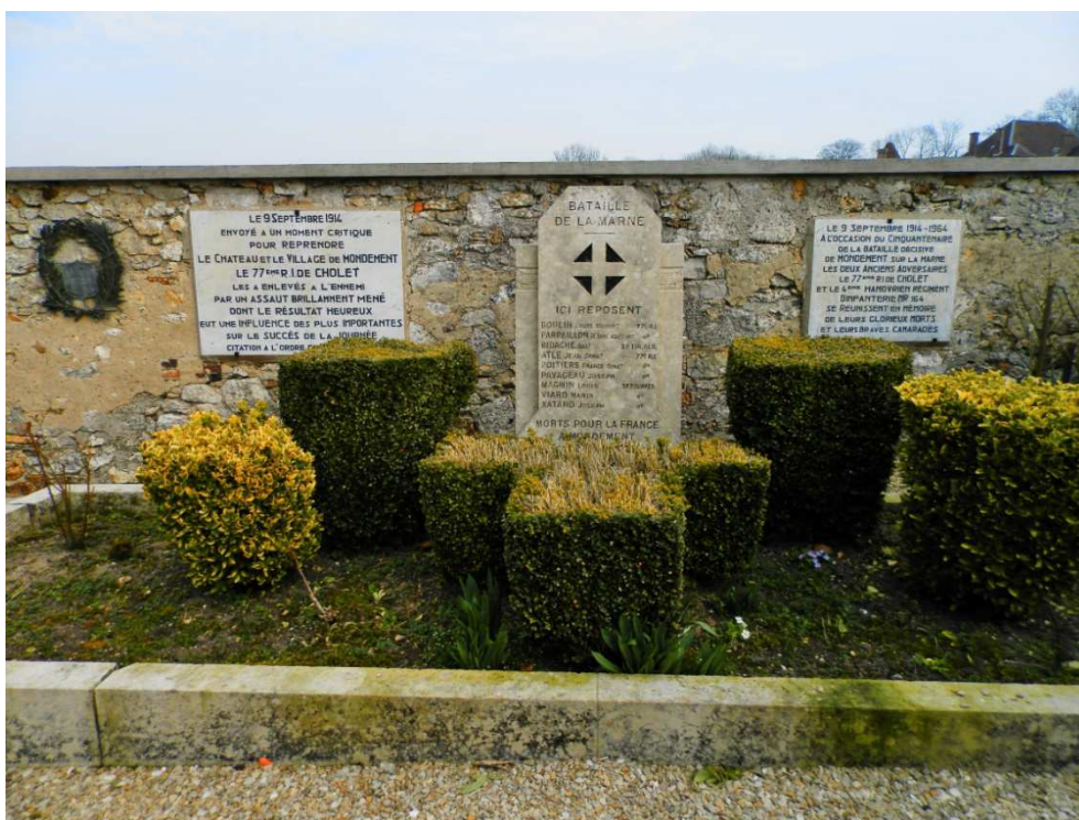
Tombe collective et plaques commémoratives dans le cimetière de Mondement Département de la Marne, 2015