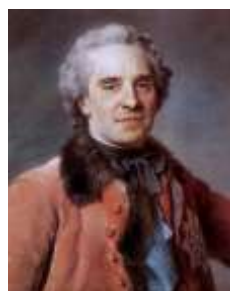
Frédéric Auguste de SAXE, roi de Pologne - Aurore de KOENIGSMARK et leur fils Maurice de SAXE Arrière-grand-père de George SAND