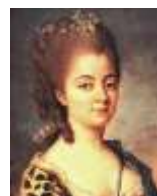
Marie Aurore de SAXE