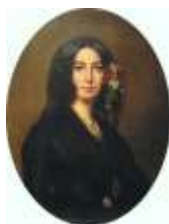
Amandine Aurore Lucille DUPIN GEORGE SAND