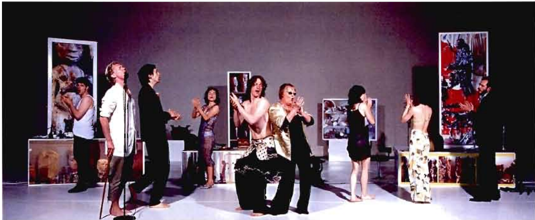
Fig. A.1 « The Barking Song »