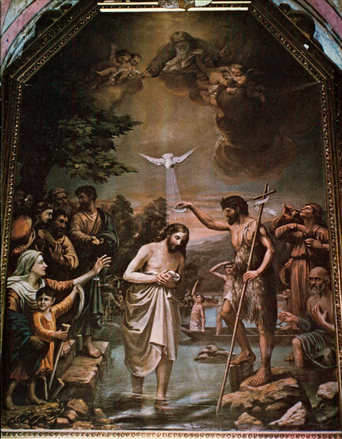
Le Baptême de Notre-Seigneur Saint-Jean-in-Montana (1890)