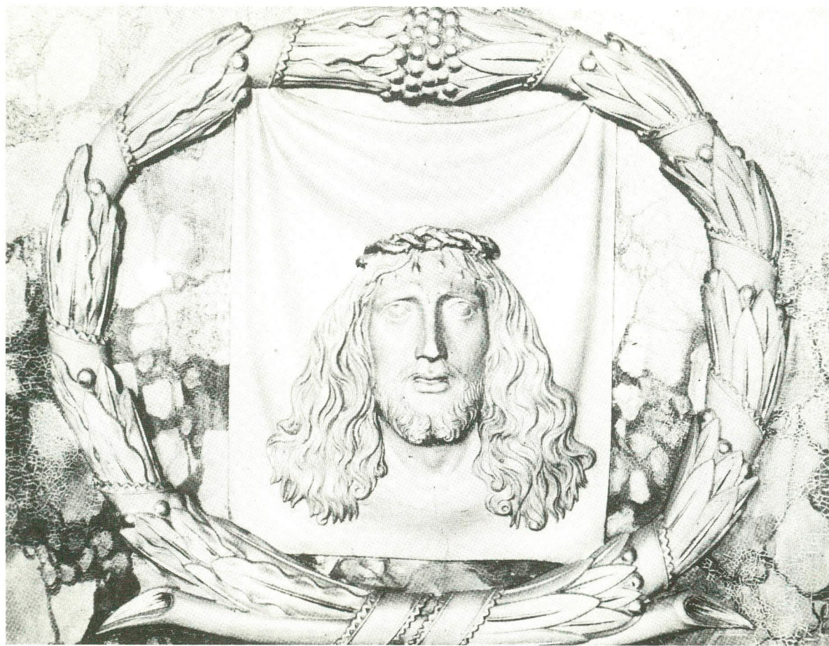
Le linge de Véronique