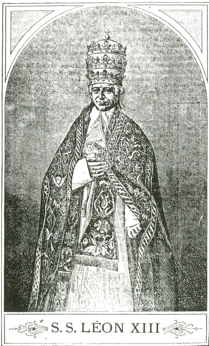
Léon XIII Dessin au crayon (vers 1890)