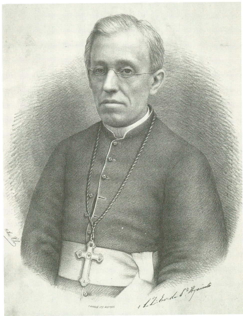
Mgr L.Z. Moreau Lithographie (1875)

(ASN, Collection de gravures et peintures)