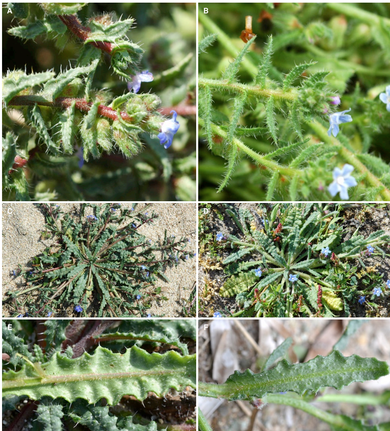
Fig. 2. – A. Anchusa crisper subsp. valincoana Paradis, Piazza & Quilichini: tiges florifères; B. Anchusa crisper Viv. subsp. crisper : tiges florifères; C. Anchusa crisper subsp. valincoana : individus fleuris; D. Anchusa crisper subsp. crisper : individus fleuris; E. Anchusa crisper subsp. valincoana : face inférieure d'une feuille; F. Anchusa crisper subsp. crisper : face inférieure d'une feuille.