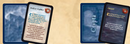
18 cartes "événement" 6 cartes "crypte"