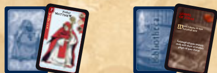
24 cartes "suspect" 8 cartes "livre de la bibliothèque"