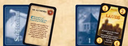
24 cartes "livre du scriptorium" 8 cartes "Messe"