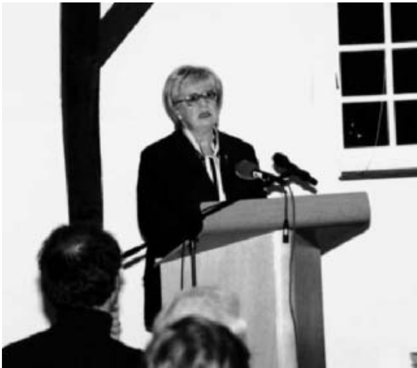
Sigrid Löffler lors de sa conférence au CNL le 23 octobre 2001