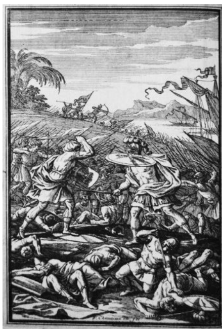
Le Moyne 1658, p. 182.

GEN FC6 L5447 651se, Houghton Library, Harvard University