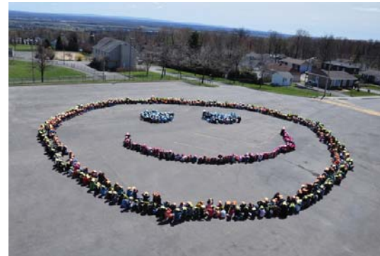
Un sourire plus grand que nature de l'école Jules-Émond!

Les élèves et membres du personnel de notre commission scolaire ont démontré que de prendre quelques minutes pour sourire durant une journée nécessite bien peu d'effort et d'investissement, mais s'avère très positif sur le moral de ceux qui travaillent si fort quotidiennement à la réussite de chacun. ●