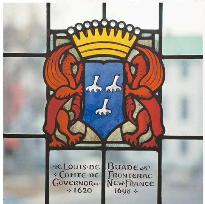
ARMOIRES DE FRONTENAC. DÉTAIL D'UN VITRAIL DESSINÉ PAR W. S. MAXWELL, 1924.

Enfin, à partir de 1924, le Canadien Pacifique inclut Frontenac dans certaines de ses affiches promotionnelles. Sur l'illustration ci-dessus, on voit Frontenac, l'attitude conquérante, devant un canon. En arrière-plan, le Château Frontenac – avec la tour centrale – est esquissé, de façon plus pâle, comme si on avait craint l'anachronisme que représentait cette association entre l'homme et l'hôtel portant son nom. L'image mythique et symbolique de Frontenac est donc partout présente dans la décoration et dans l'histoire de l'hôtel. Au détour d'une porte, sur une tapisserie, au-dessus d'un manteau de cheminée, etc.