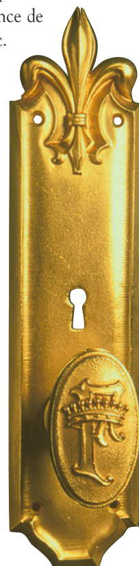
BOUTON ET PLAQUE DE SERVICE EN LAITON COULÉ, MANUFACTURÉS PAR P. & F. CORBIN, 1893.

Dès les débuts, il est convenu entre les différents promoteurs que l'hôtel de grand luxe incarnera la résidence de Louis de Buade, comte de Palluau et de Frontenac. En créant ce lien qui fait du bâtiment la résidence supposée d'un gouverneur de la Nouvelle-France, on renforce l'image de château français de l'hôtel. L'effigie de Frontenac y est très visible. Lorsque Bruce Price dessine la plaque et le bouton des portes, il surmonte la première de la fleur de lys, pour rappeler la France et fait graver sur le bouton de la porte un F stylisé, enserré dans la couronne à neuf diamants des comtes français.