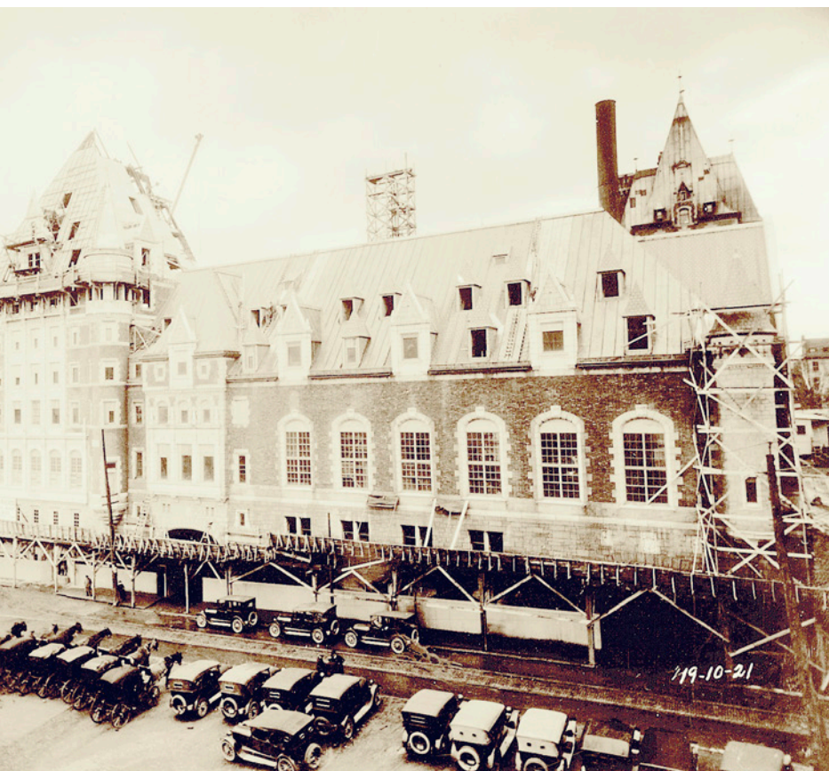
LE CHÂTEAU FRONTENAC AVANT LA CONSTRUCTION DE LA TOUR CENTRALE, 1921.

Toutefois, un certain nombre est aussi originaire du nord-est des États-Unis. Ce nombre de 446 peut étonner pour un premier mois d'opération. Deux critères semblent pouvoir expliquer l'importance de ce chiffre : les célébrations de Noël et du Nouvel An et la tenue du carnaval d'hiver. Le mois de mars 1894, quant à lui, semble une période plus creuse, avec ses 312 clients. Montréal regroupe encore l'intensité la plus élevée de fréquentation alors que le reste provient principalement des régions de la côte est américaine, des Provinces Maritimes, de l'axe laurentien et, de façon plus dispersée, de la région des Grands Lacs.