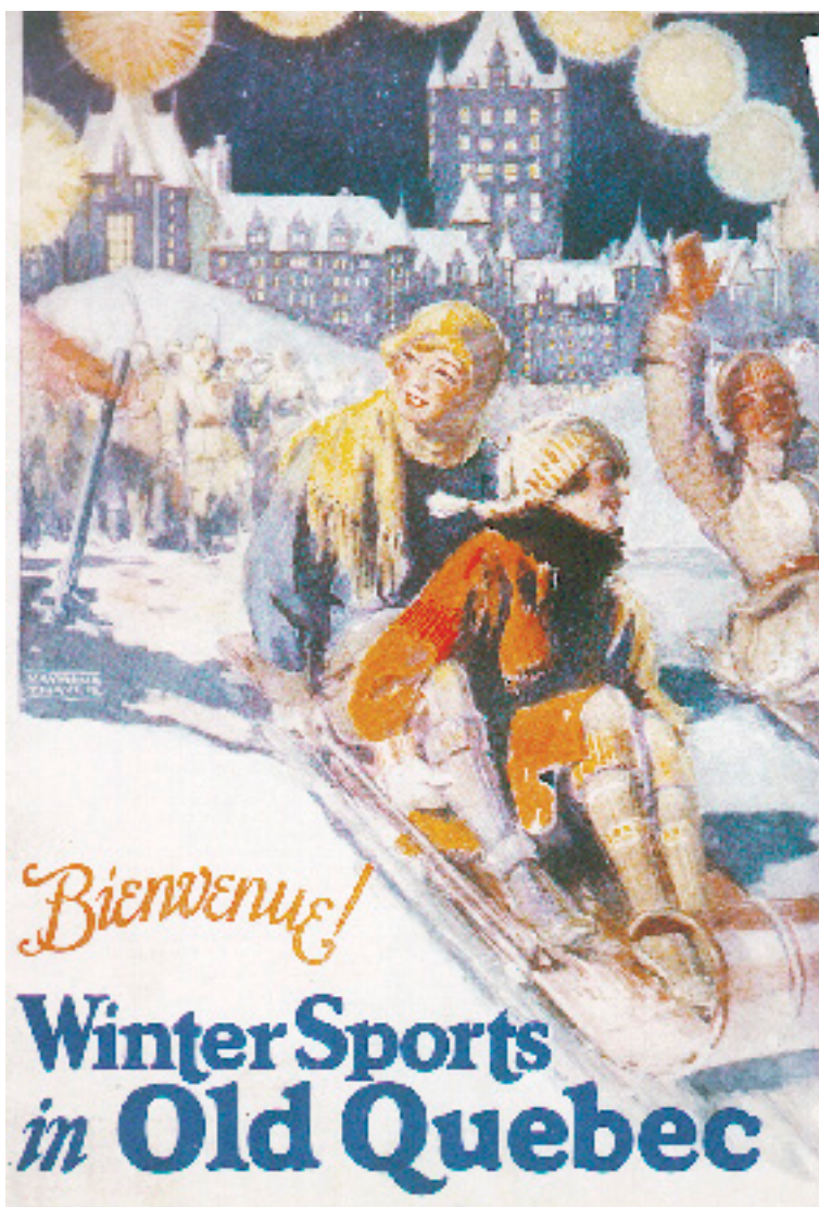
AFFICHE DU CANADIEN PACIFIQUE « WINTER SPORTS IN OLD QUEBEC ».

Après 1924, d'autres travaux seront entrepris. En 1926 d'abord, alors qu'un incendie ravage l'aile Riverview. Dès l'été, les travaux de reconstruction sont mis en chantier. Bien que l'apparence extérieure reste identique à celle de l'aile incendiée, de grandes améliorations sont apportées, dont la plus marquante est la construction de la grande salle-à-dîner : la salle Champlain, aussi appelée le Riverside Lounge. On apporte un soin particulier à la décoration de ce lieu de grand luxe consacré à la gastronomie. Là encore, les symboles sont partout. La salle, éclairée de quatre grandes baies vitrées, offre une vue imprenable sur le fleuve Saint-Laurent. Son plafond est orné de poutres de chêne qui le divisent en douze sections où s'alternent successivement douze panneaux, les uns montrant le lion et la rose britanniques; les autres, la fleur-de-lys et le griffon français. Le panneau figurant au-dessus de la cheminée illustre le « Don de Dieu » surmonté de la couronne royale de France.