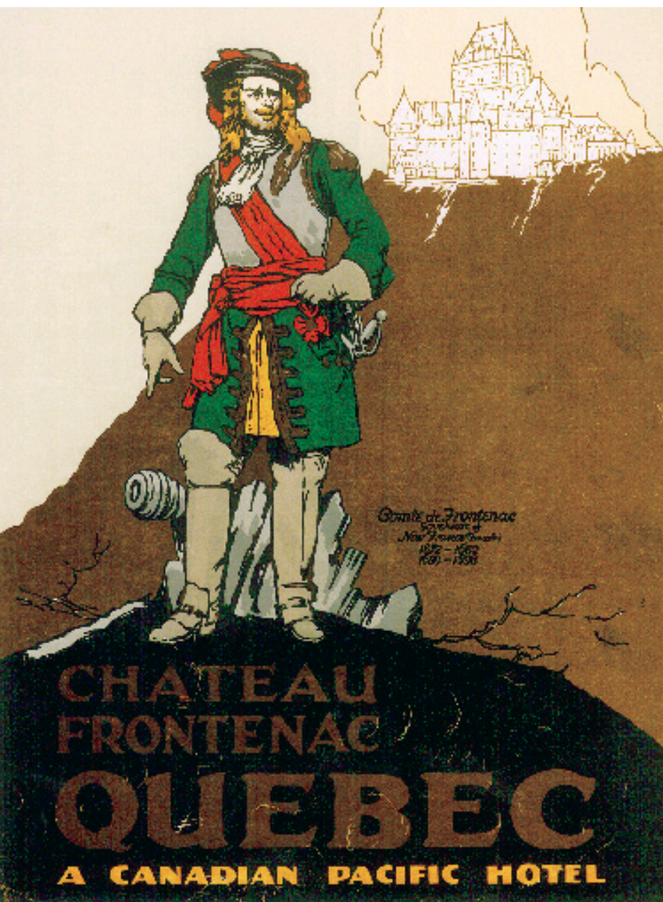
AFFICHE PROMOTIONNELLE DU CHÂTEAU FRONTENAC. Après 1924, puisqu'on peut voir l'aile Maxwell en arrière-plan.