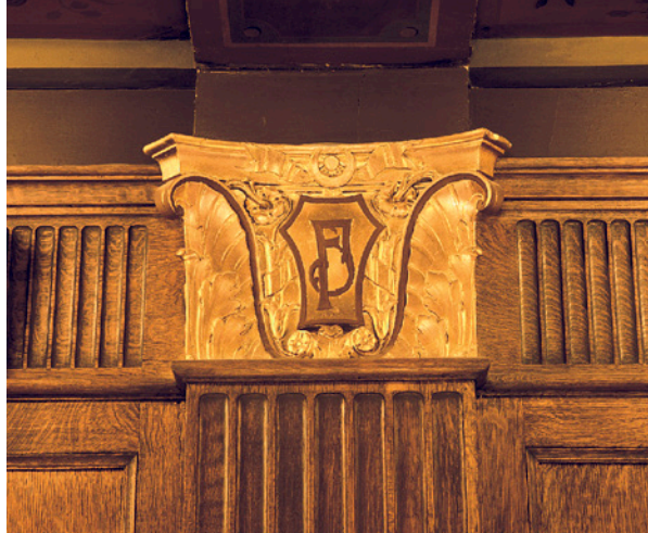
DÉTAIL DE LA DÉCORATION CONÇUE PAR W. S. MAXWELL, 1924.