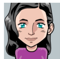
Bio / T. Psy