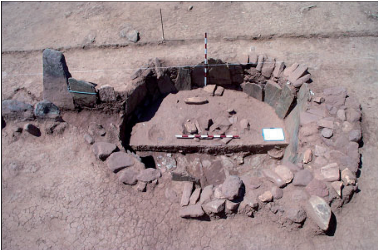
Fig. 4 : Dernière étape de la fouille du tholos. Dans la moitié nord, la roche-mère a été atteinte ; la moitié sud est prête pour la fouille.

Fig. 4: Late stage in the excavation of the tholos. In the northern half the bedrock has been reached; the southern half of the deposit is ready for excavation.