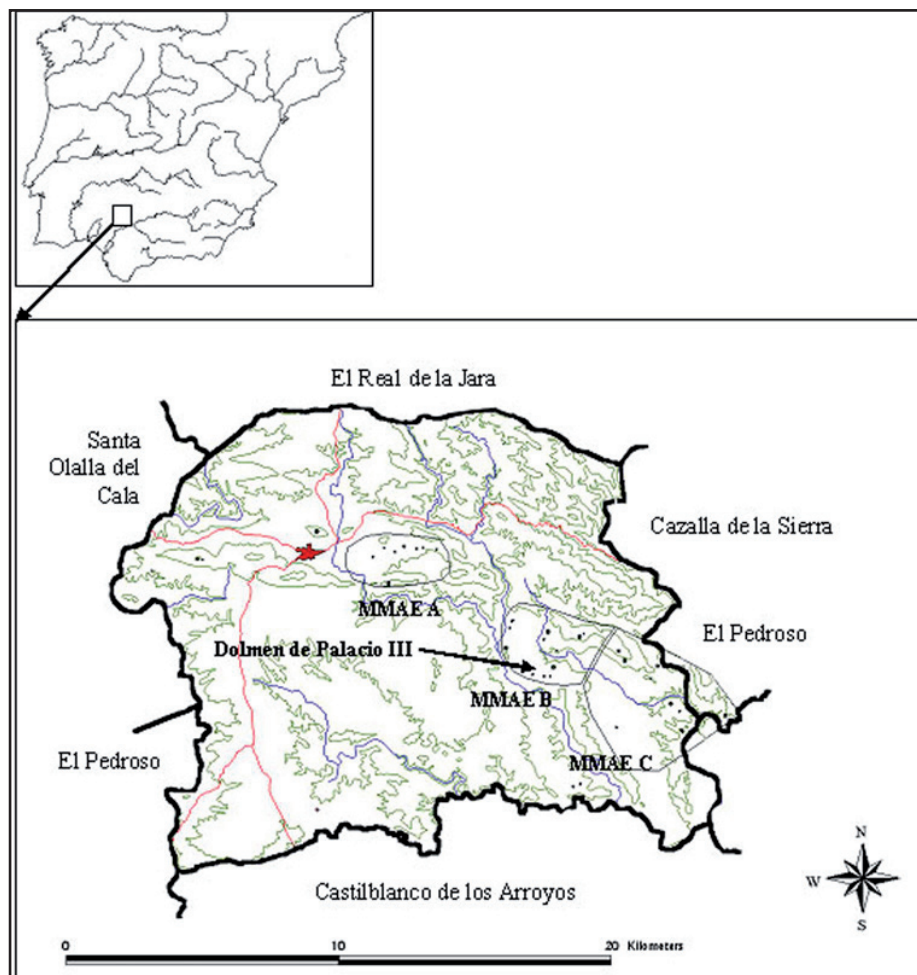
Fig. 1 : Localisation des secteurs à l'intérieur de la municipalité de Almadén de la Plata.

(Relecture du résumé anglais / Revision of the English abstract: Chris SCARRE)