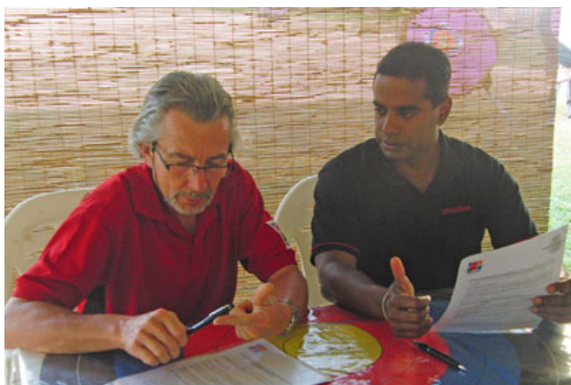
Signature du partenariat

Le Centre de Colombo se situe dans un environnement multisport (rugby, piscine, terrain de tennis, squash, badminton, salle de musculation, etc.) Ce nouveau centre d'entraînement de tir à l'arc dispose d'un terrain permanent pour le tir à l'arc où des professionnelles s'entraînent chaque jour. Des cours sont au programme pour les débutants avec une équipe de professionnelle composée d'un directeur/entraîneur, d'un chef de projet/entraîneur et deux entraîneurs supplémentaires. Ils parlent tous l'anglais.