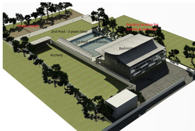
Dessin aérien du Centre