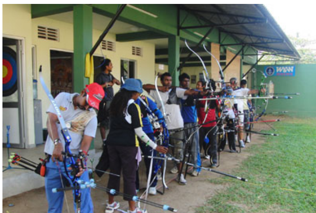
Entraînement des archers au Centre