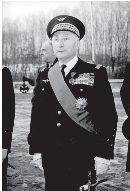
Le général Valin