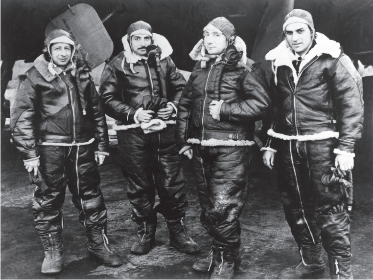
Le général Valin avec les membres de l'équipage d'un bombardier B-17 de la 8 th Air Force