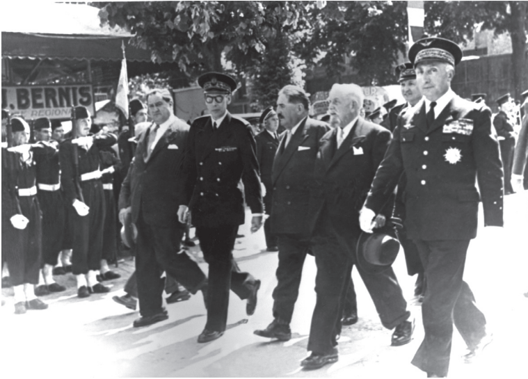
Laurent Eynac (au centre) lors de l'inauguration d'une exposition à Limoges avec le général Valin (extrême droite), vers 1955