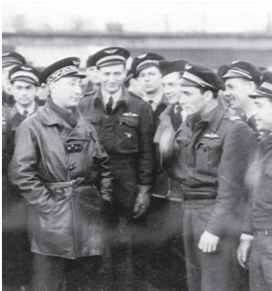
Le général Valin inspectant le 145 e Wing (groupe de chasse « Alsace »), à Anvers, fin 1944