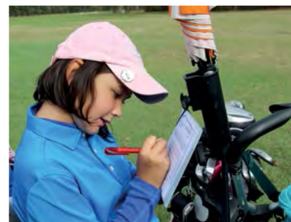
■ On s'applique pour remplir la carte