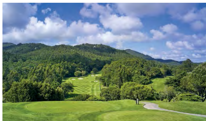
■ Le trou 16 de Penha Longa, l'un des plus durs d'un parcours vallonné où il convient de rester droit.