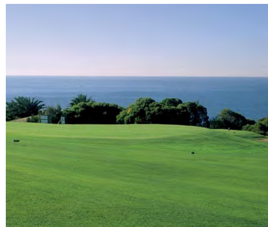
■ Le trou 3 de Quinta da Marinha, un par 4 en dodleg droit, descendant en direction de l'océan.

*NDLR : Remerciements aux golfs qui ont fourni toutes les photos.