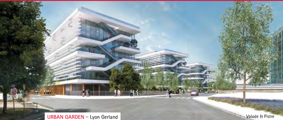
URBAN GARDEN – Lyon Gerland