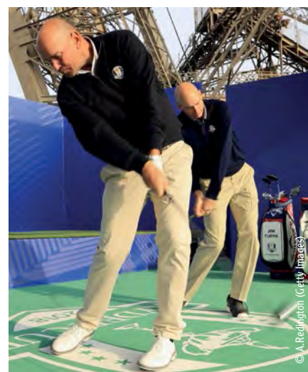
Swinguer depuis la Tour Eiffel : Thomas Bjorn s'en souviendra toujours

Le mardi, après avoir été reçus à l'Élysée pour un petit déjeuner par le président de la République, Emmanuel Macron, les deux capitaines se sont dirigés vers la Tour Eiffel où ils ont swingué du 1er étage. Puis, l'après midi, ils ont donné une conférence de presse diffusée mondialement.