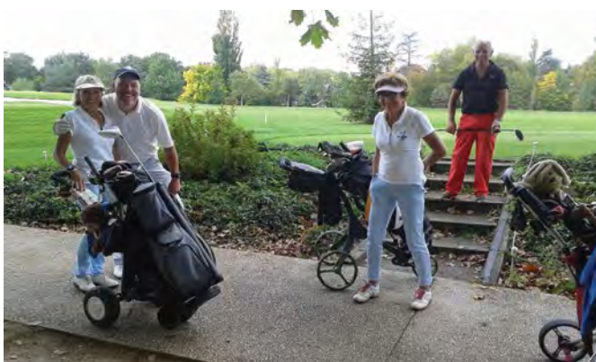
■ Le podium est loin mais la bonne humeur règne.