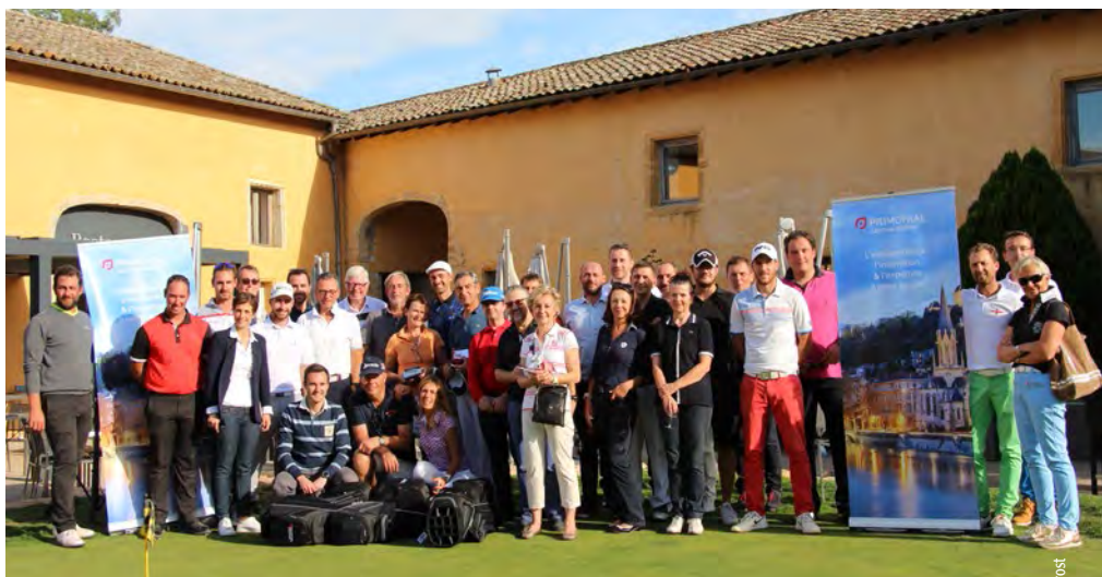
■ Tous les participants réunis autour des partenaires

*Primonial 2 rue Président Carnot 69002 Lyon – Tel 04 37 65 18 70