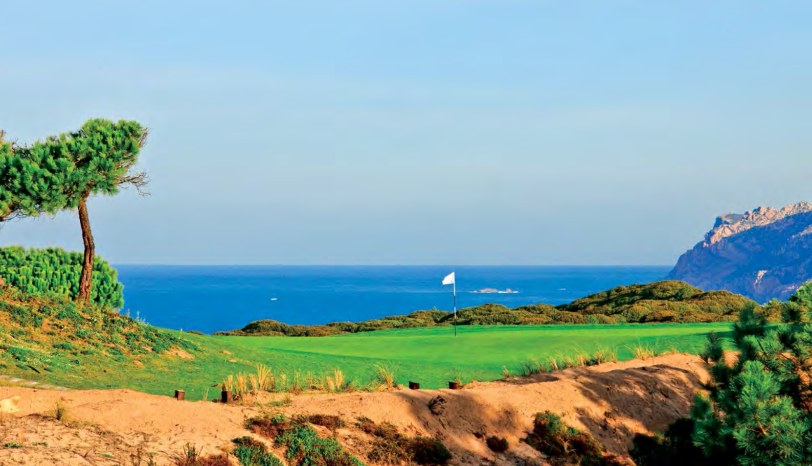
■ Le trou 14 de l'Oitavos Dunes, un par 3 signature du parcours, avec un fossé à survoler avant de toucher le green, L'océan et la montagne de Sintra en arrière plan.