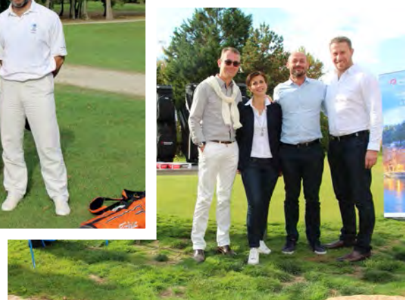
■ Le staff de l'agence Primonial à Lyon Cordeliers