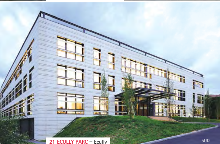
21 ECULLY PARC – Ecully