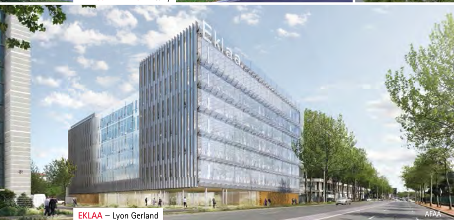
EKLA A – Lyon Gerland