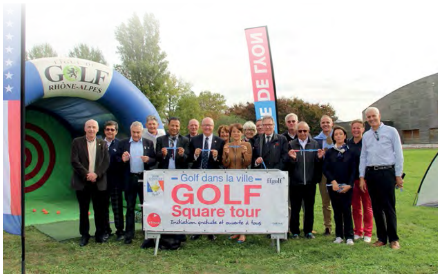
■ Les personnalités institutionnelles et fédérales réunies