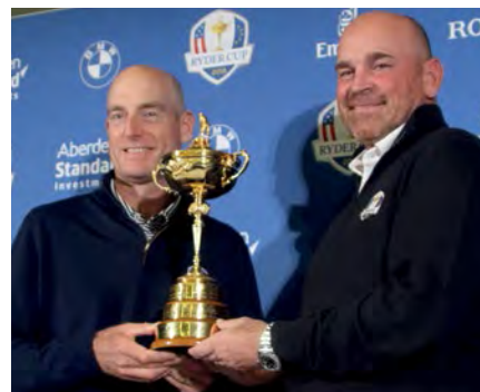
■ Jim Furyk (47 ans) et Thomas Bjorn (46 ans) deux capitaines réunis autour du Graal

*Le même jour était cependant dévoilé à Paris le parcours du Tour de France 2018