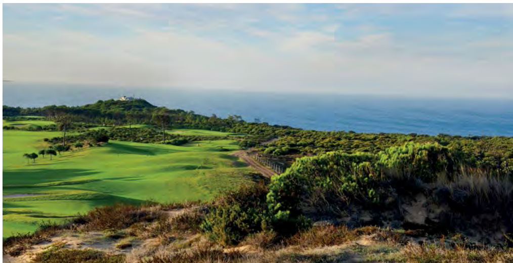
■ Le trou 11 de l'Oitavos Dunes, un par 4 avec un départ surélevé qui offre un point de vue magnifique.

Entre les dunes et les pins parasols, ce parcours est assez franc à jouer, avec de larges fairways, mais il représente malgré tout un solide test golfique, surtout quand le vent commence à souffler fort et que vous n'avez pas l'habitude de vous mesurer à un links, avec du sable en guise de rough. Deux petits bijoux de par 3 sont à relever, le 9 et le 14, avec l'océan et la montagne en arrière plan.