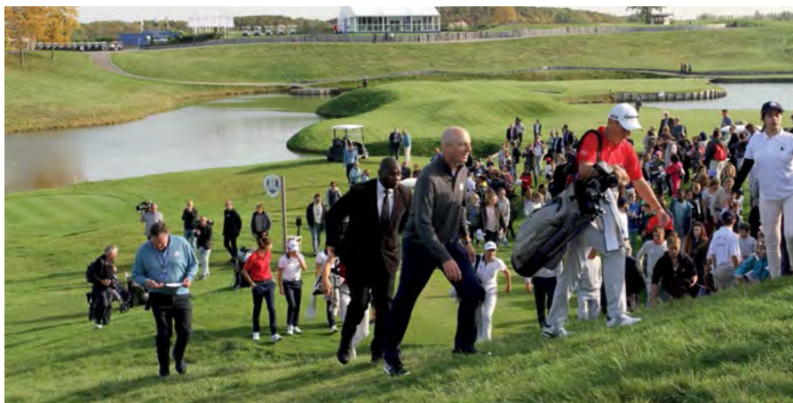
■ Jim Furyk a été impressionné par le parcours du Golf National

« C'est déjà énorme d'être capitaine de la Ryder Cup, mais driver de la Tour Eiffel c'est quelque chose que je n'oublierai jamais » commentera un peu plus tard Bjorn, lors de la conférence de presse programmée à l'hôtel Pullman tout proche. Celle-ci mit un terme à deux jours inoubliables débutés le lundi 16 avec, dans le cadre des célébrations du « One year to go », un ensemble d'ani-