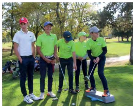
■ Des Stéphanois concentrés...

De retour du Valderrama Masters où son honorable 30 e place était cependant insuffisante pour lui permettre de poursuivre sa fin de saison avec les gros tournois conduisant à Dubaï, le lyonnais (43 ans) paraissait à son arrivée un brin fatigué. Mais il n'en avait pas pour autant oublié ses cadeaux personnels, et, peu à peu, son visage s'éclaira de plaisir.