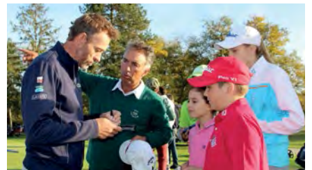
■ Séance signature d'autographes...

Non, car si j'ai été présent au début sur deux-trois événements, ça correspondait avec mon calendrier, mais ensuite j'ai laissé faire Fanny mon épouse. Ce n'est pas une excuse (rires), même si ça occupe la tête un peu plus : ça fait 20 ans que je suis sur le Tour et c'est bien aussi de penser à autre chose que le tournoi suivant. D'ailleurs le BFGT devrait prendre de l'ampleur en 2018 mais ça n'empêche pas de s'entraîner et d'être motivé ! ». ■ R.B