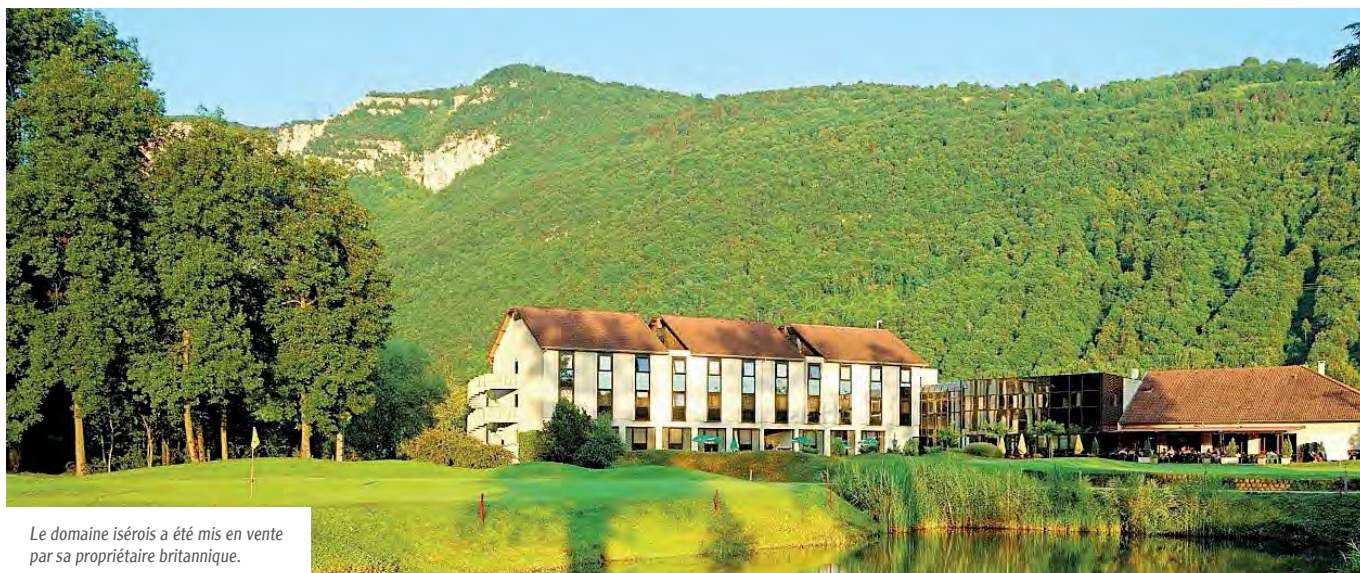
Le domaine isérois a été mis en vente par sa propriétaire britannique.