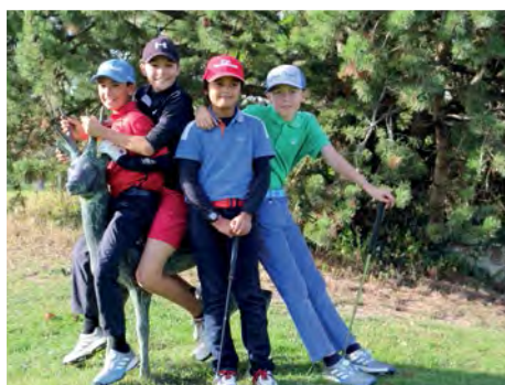
■ ...et des Grenoblois enjoués

Peu avant la plaisante lecture des récompenses en présence de fidèles partenaires (Skimp, Golf Plus Lyon et Nutrisens), Raph' s'est astreint au rituel question réponse avec les mômes. Notre jeune quarda a évoqué quelques souvenirs, puis, il ne manqua pas de remercier les enfants avec cette observation due à sa saison compliquée et ses interrogations implicites (voir par ailleurs) « Je suis aussi heureux d'être en votre compagnie, et plus tard, quand je serai à la retraite, je pourrai passer plus de temps avec vous, mais ça n'est pas pour l'an prochain ! ». La fatigue avait définitivement disparu de son visage à l'évidence radieux. ■ R.B