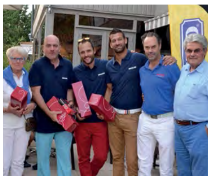
■ L'équipe du Cook empoche le Brut (à gauche) et le Café Juliette victorieux en net.