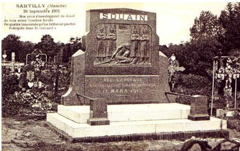
Carte postale du monument aux fusillés de Souain dans le cimetière de Sartilly (Manche). 1925.