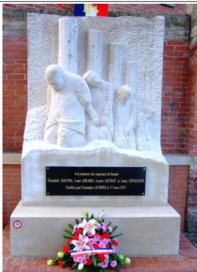
© Jean-Pierre Husson CRDP de Champagne-Ardenne

Source : « Fusillés pour l'exemple - Les Caporaux de Souain, le 17 mars 1915 », Jacqueline Laisné © Editions Alan Sutton, 2002, pour la présente édition.