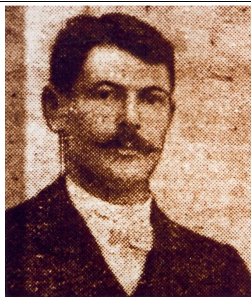
Lucien BERSOT est né le 7 juin 1881 à Authoison (Haute-Saône).

Il a été fusillé le 13 février 1915 à Fontenoy (Aisne) et réhabilité le 12 juillet 1922.