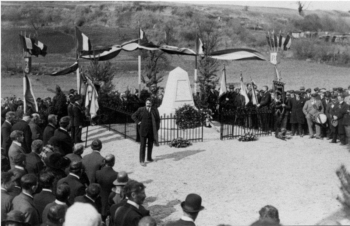
L'inauguration du monument des fusillés de Vingré, 25 avril 1925.