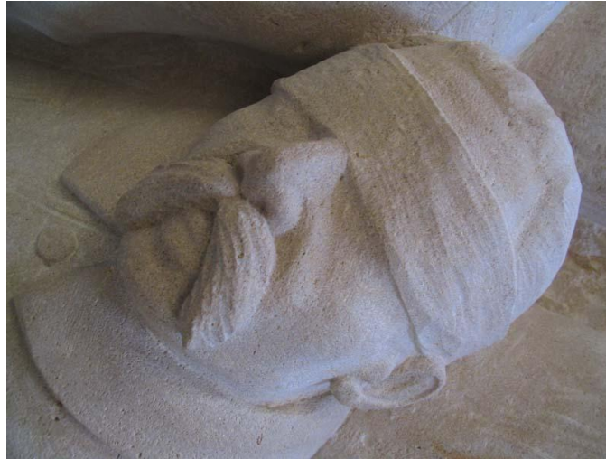
Photographie montrant un détail du monument en mémoire des fusillés de Souain (tête)

« Le monument en pierre blanche inauguré en 2007, se dresse face à l'hôtel de ville de Suippes où a siégé le 16 mars 1915 le conseil de guerre qui a condamné à mort les caporaux de Souain. Il est adossé à l'ancien corps de garde, à l'emplacement d'un appartement détruit en 1992, dans lequel ils ont été incarcérés avant d'être condamnés à mort et fusillés ».