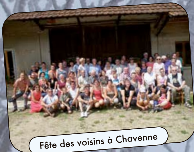
Fête des voisins à Chavenne