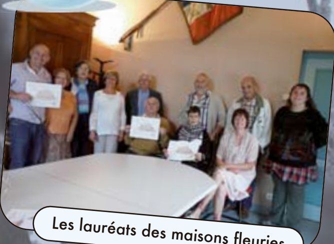
Les lauréats des maisons fleuries