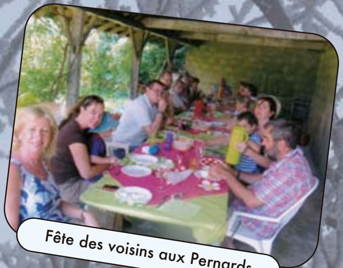
Fête des voisins aux Pernards