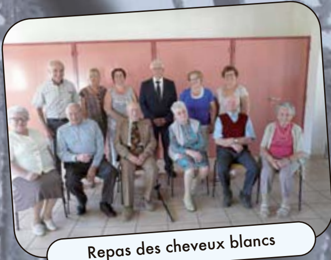
Repas des cheveux blancs