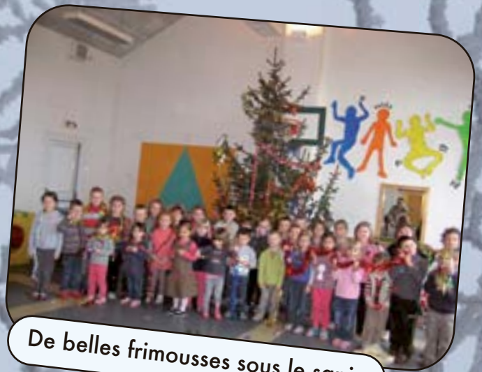
De belles frimousses sous le sapin