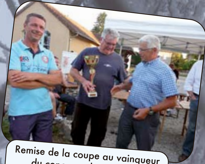
Remise de la coupe au vainqueur du concours de pétanque