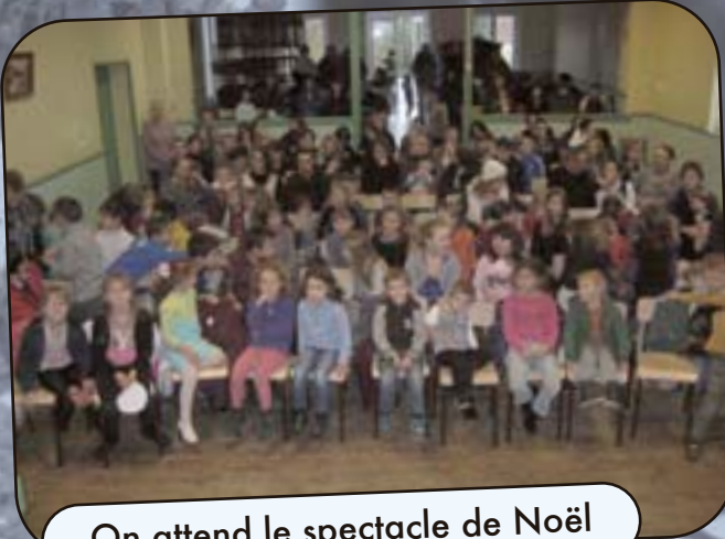
On attend le spectacle de Noël