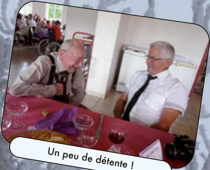
Un peu de détente !