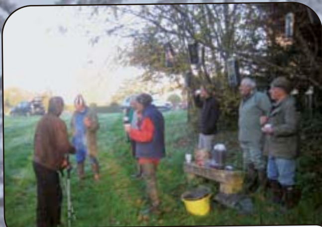
Le meilleur moment de la pêche de l'étang : c'est le casse-croûte.