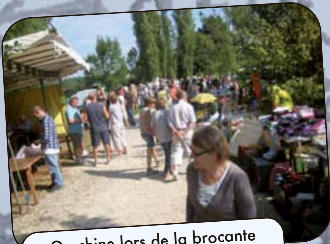
On chine lors de la brocante du 7 septembre 2014