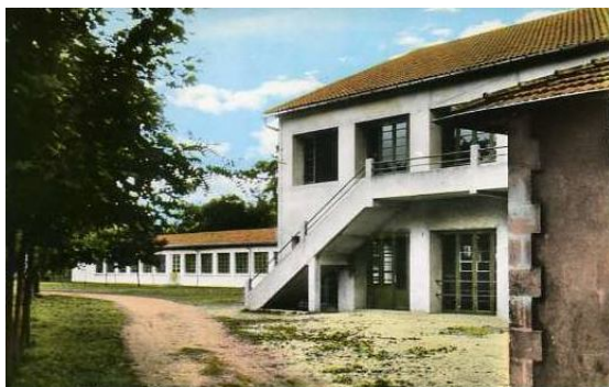
La carte postale du cinquantenaire