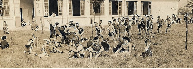
1958 La section des petits