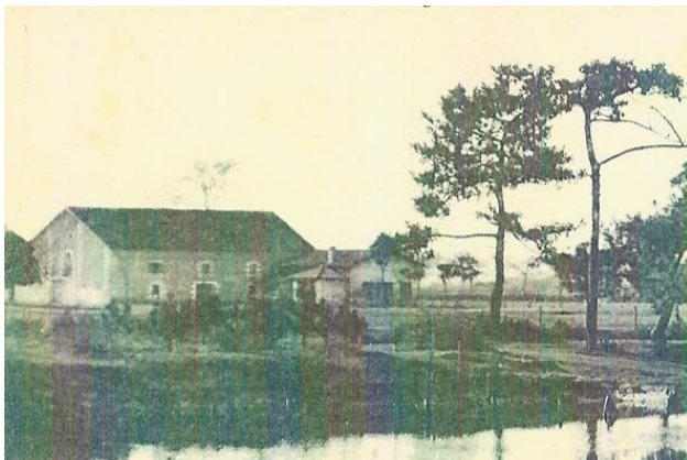
1940 Pas encore une colo ! Mais des écuries entre La Hume et La Teste