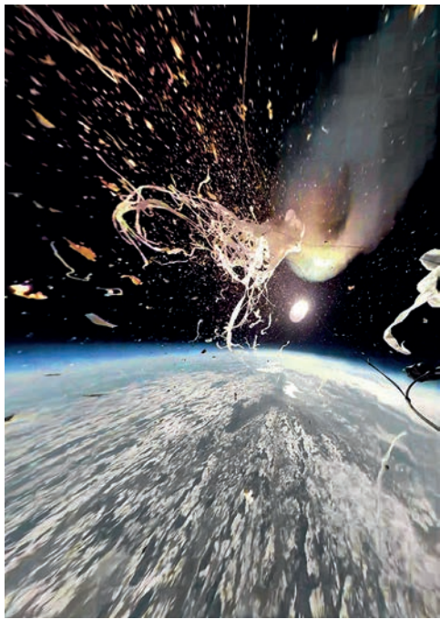
Marie Lienhard, Logics of Gold , photogramme au moment de l'explosion de l'or, flocons d'or 22 carats, feuille métallique or, ballon météo et hélium, caméra panoramique 360°, GPS, tirage photo, 180 x 104 cm, 2018.