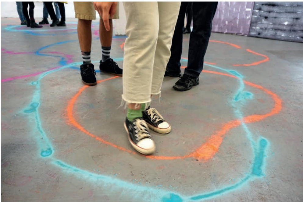
Sophie Inmann, Record , craie en aérosol, action, 2019.