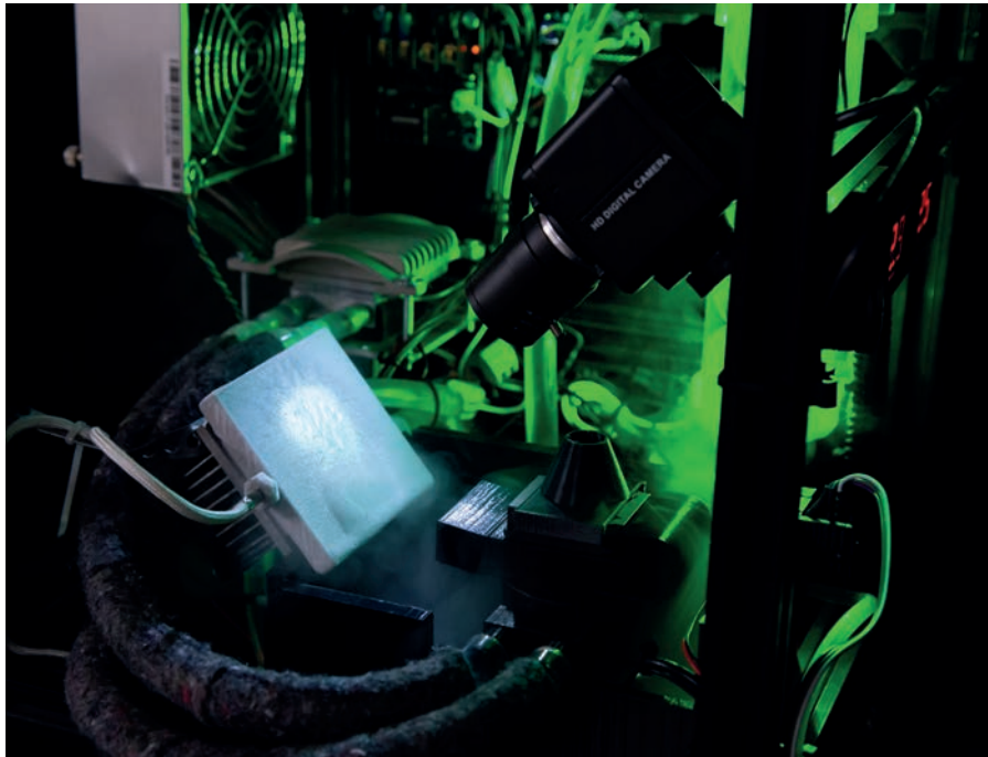
Michel Winterberg, Melting - the show must go on! , projection, webcam, équipement électrotechnique avec brume, glace et lumière, ordinateur et haut-parleur, 2020.