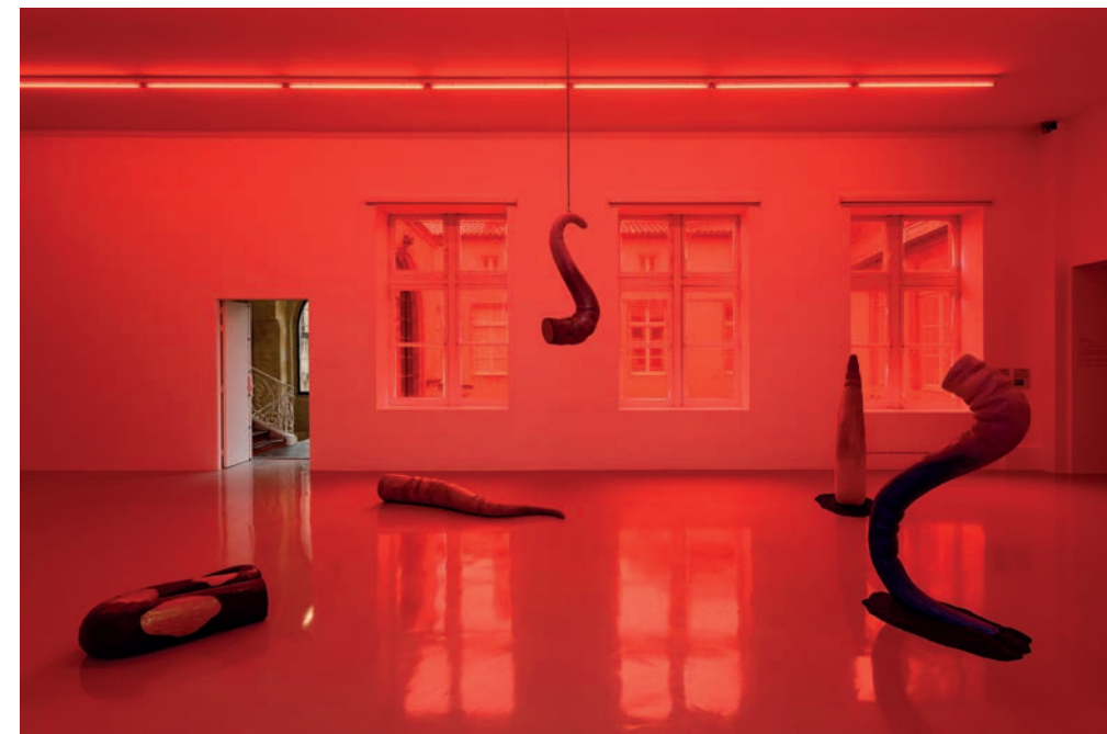
↑ Tarek Lakhrissi This Doesn't Belong to Me , 2020 Vue d'installation, À plusieurs, 49 Nord 6 Est - Frac Lorraine