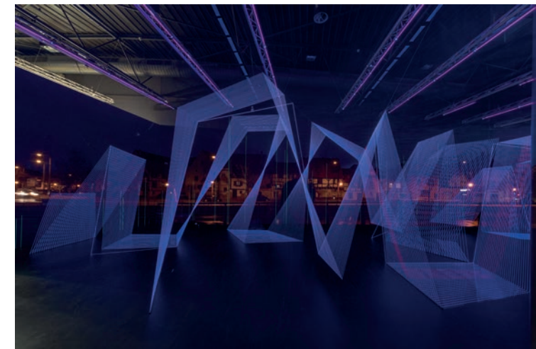
→ Vue de l'exposition « Jeongmoon Choi: Le Pouls de la Terre », FRAC Alsace, 2020.

Le catalogue est en vente au prix de 5 €.