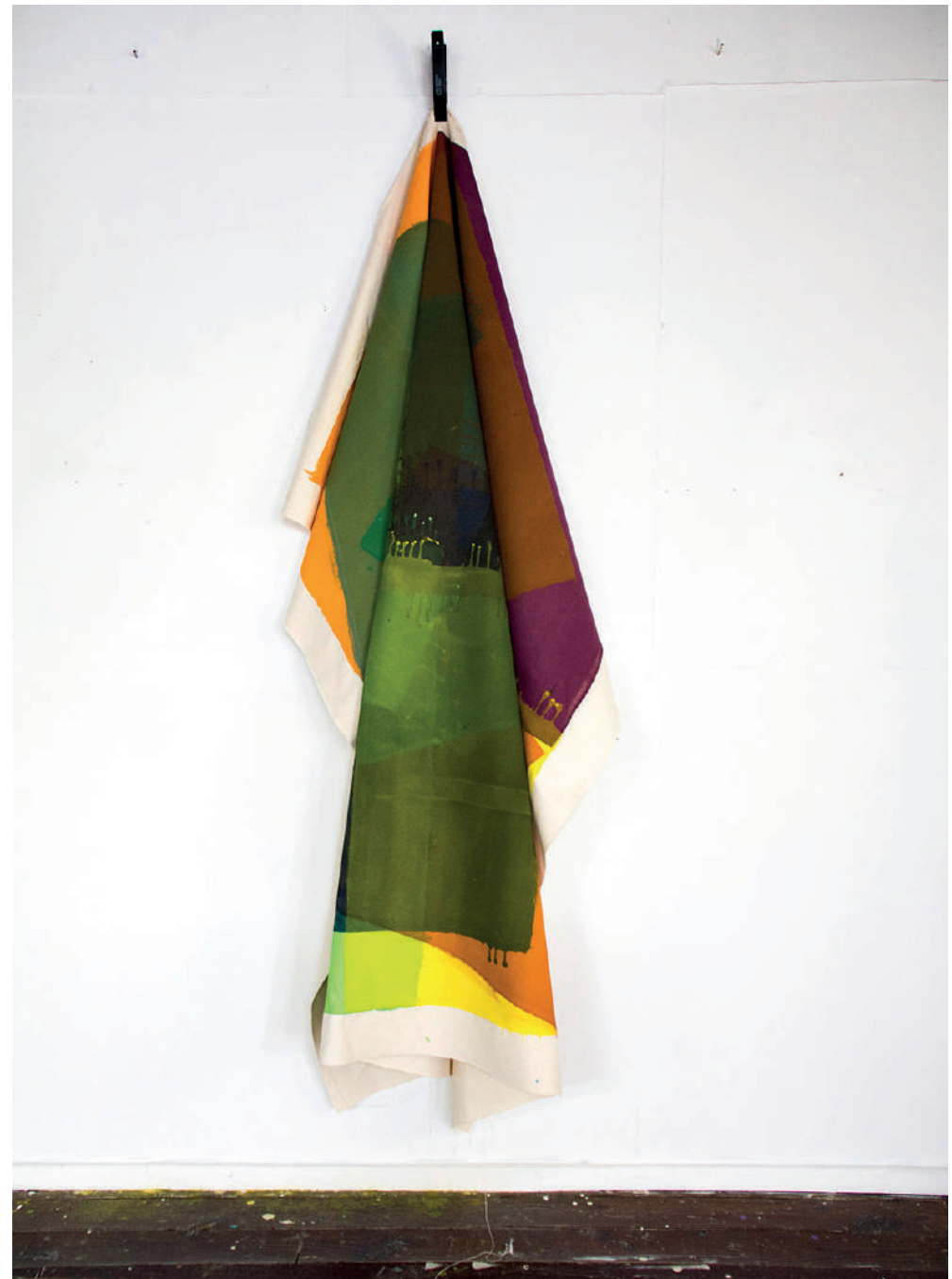
Mariejon de Buijs, Repetition 9, folded paintings , 9 toiles, acrylique sur coton non blanchi, pincés d'origine industrielle 192 x 210 cm chacune, 2020.