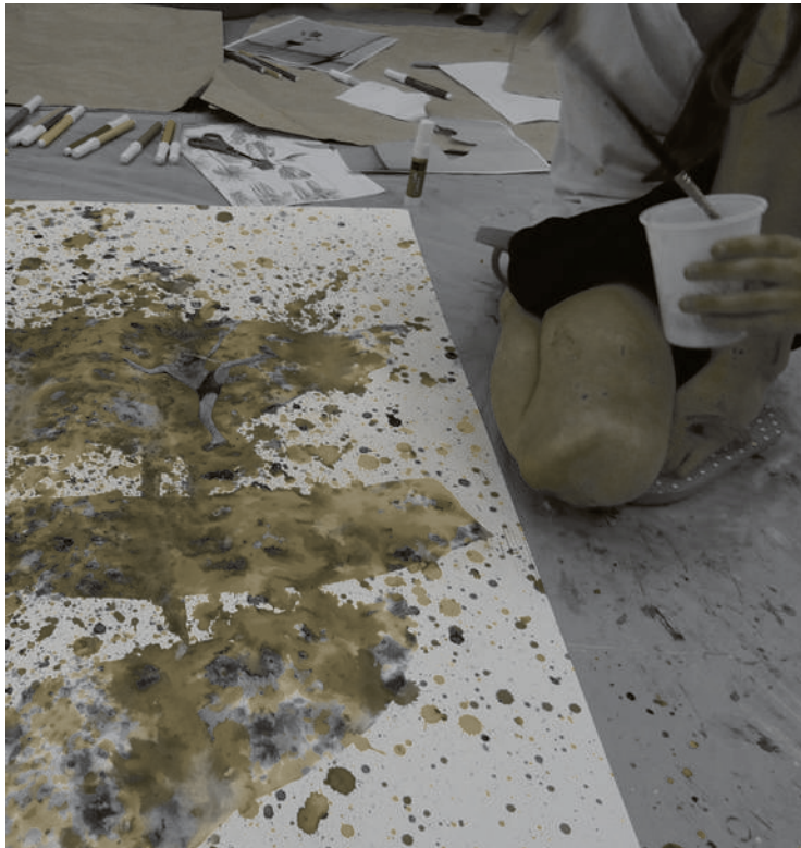
← Atelier au FRAC Alsace

Le contenu de ces ateliers vous sera communiqué par email et sur les réseaux sociaux : abonnez-vous à notre newsletter ou suivez nos pages Facebook et Instagram.