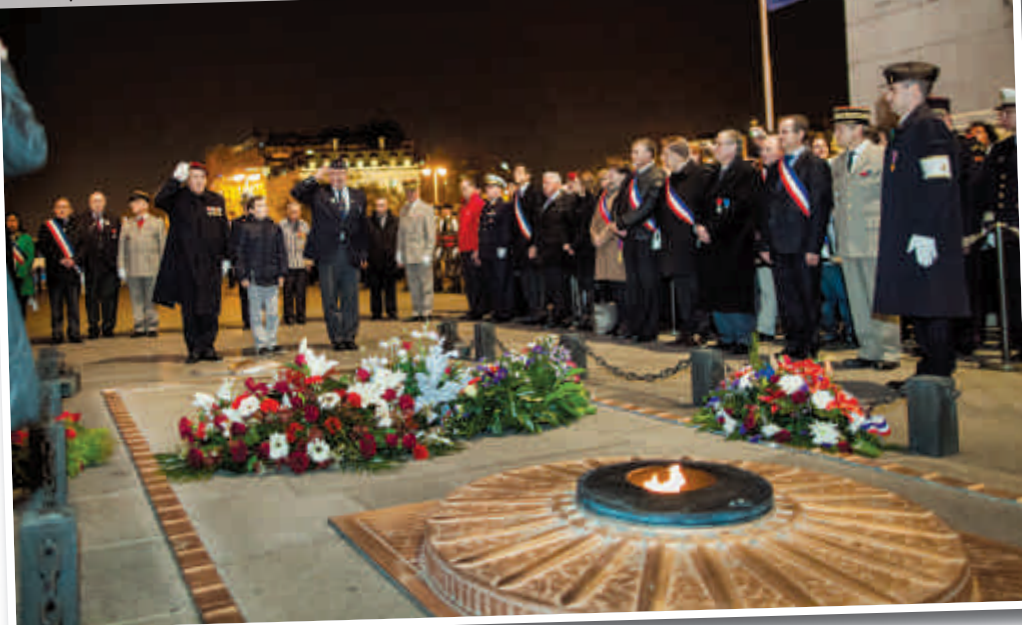
Ravivage de la Flamme du Soldat Inconnu, sous l'Arc de Triomphe, en présence de jeunes Maisonnais, le 10 novembre.