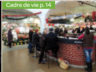
Cadre de vie p. 14