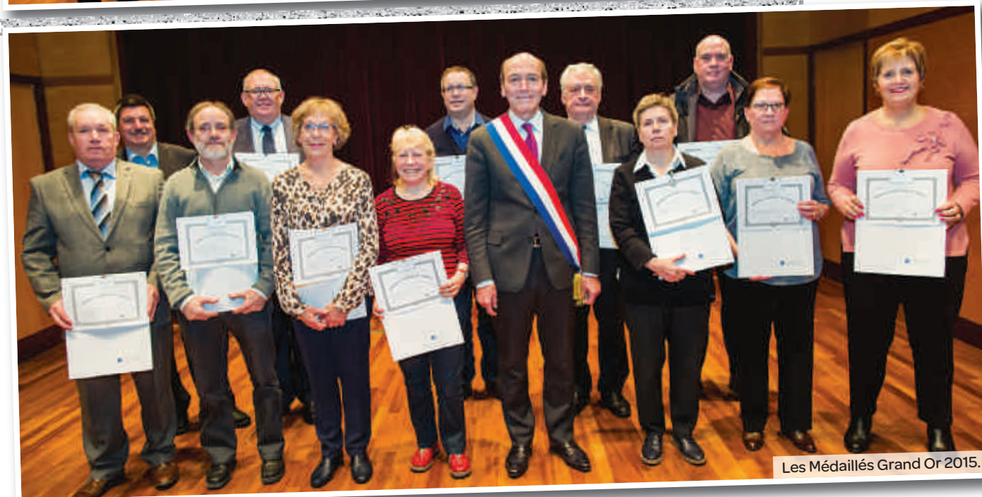
Les Médailleurs Grand Or 2015.