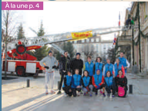
À la une p. 4