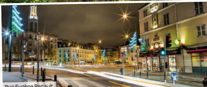
Rue Eugène Renault.