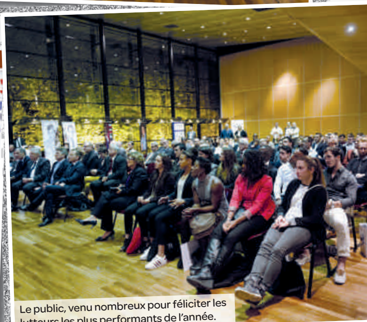
Le public, venu nombreux pour féliciter les lutteurs les plus performants de l'année.