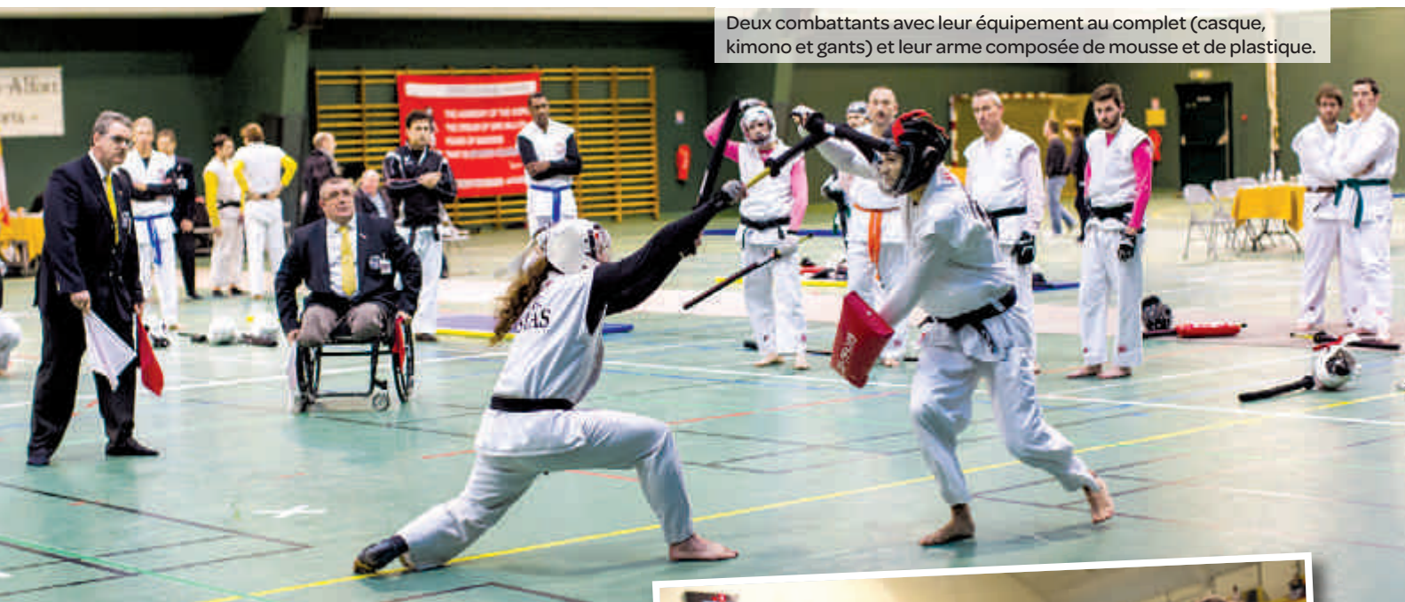
Deux combattants avec leur équipement au complet (casque, kimono et gants) et leur arme composée de mousse et de plastique.