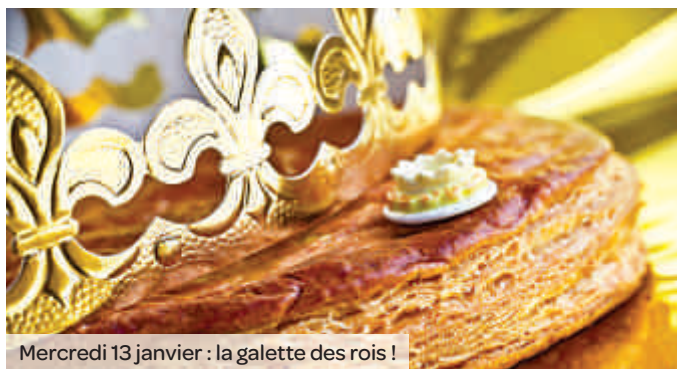
Mercredi 13 janvier : la galette des rois !