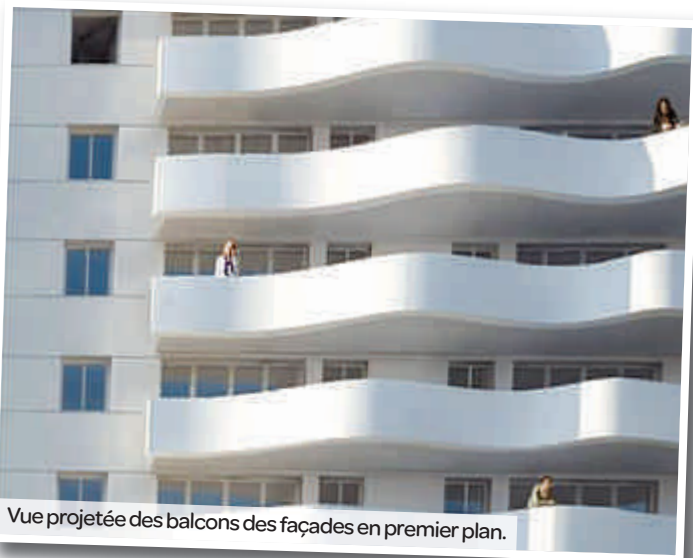
Vue projetée des balcons des façades en premier plan.

Très mobilisé sur ce dossier, M. le Député-Maire Michel Herbillon a participé à la présentation du projet aux habitants lors d'une réunion publique qui s'est tenue le jeudi 3 décembre dernier au Moulin Brûlé.