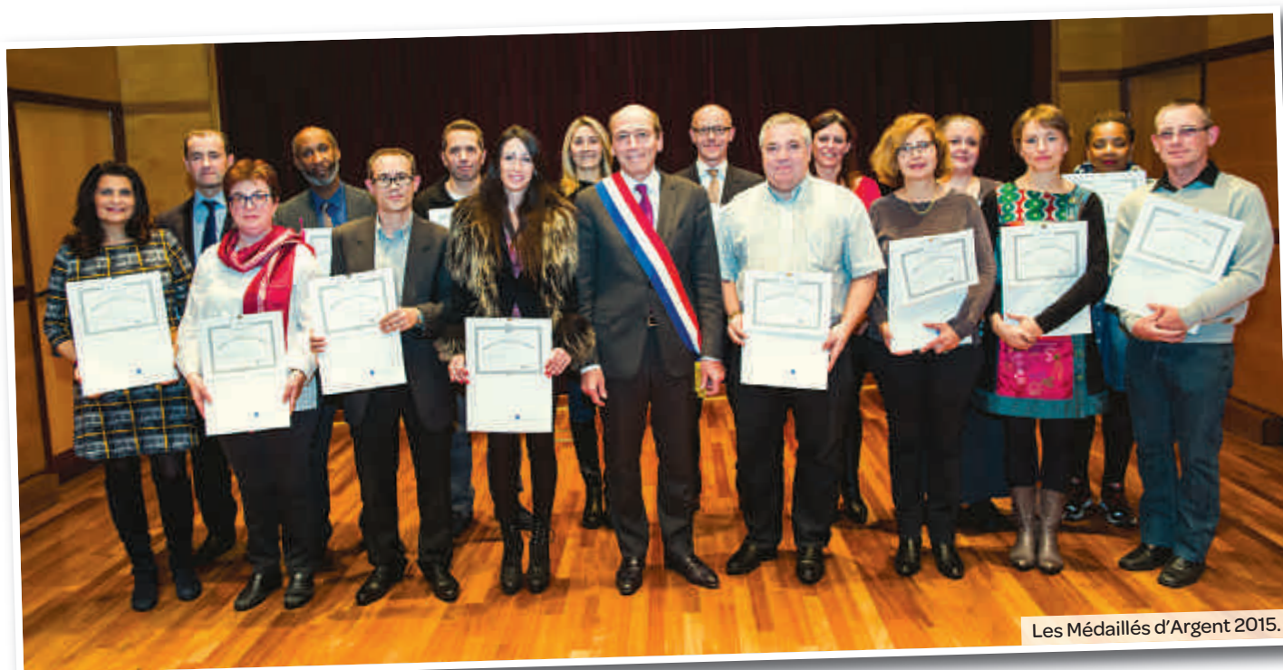
Les Médaillés d'Argent 2015.

La Ville a organisé le 23 novembre dernier une cérémonie officielle de remise des diplômes des médailles du travail pour 44 Maisonnais présents. Cette soirée avait pour but de rendre respectivement hommage à 20, 30, 35 et 40 années de carrière dans le secteur privé.