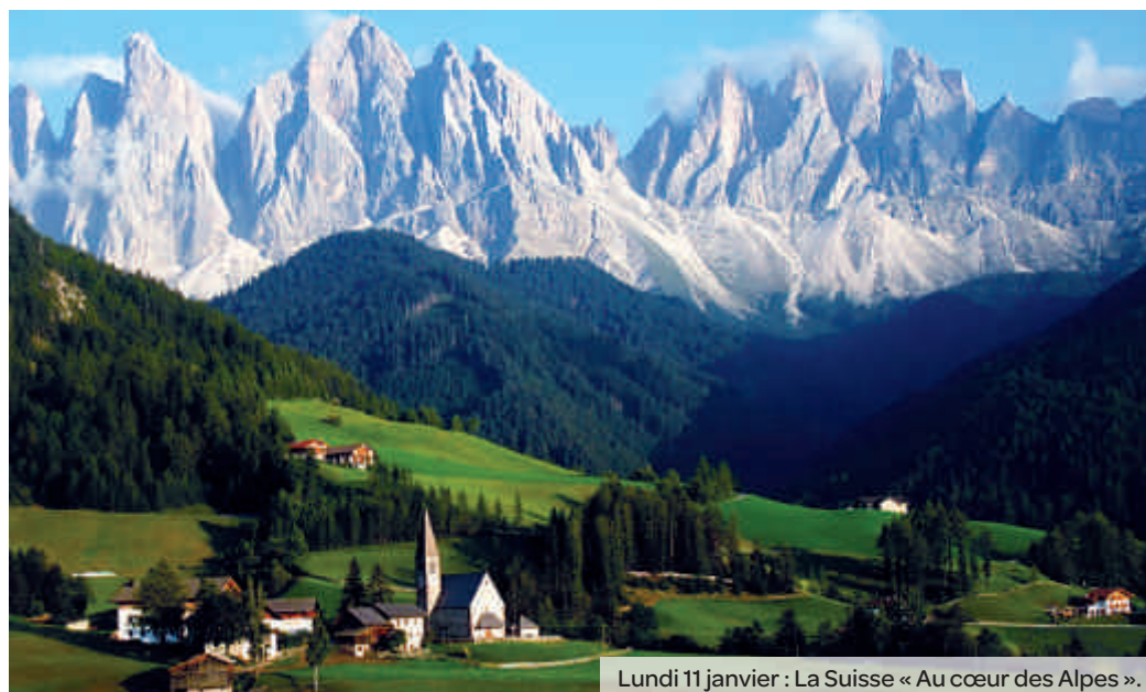
Lundi 11 janvier : La Suisse « Au cœur des Alpes ».