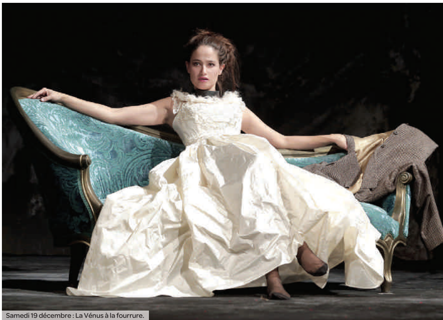
Samedi 19 décembre : La Vénus à la fourrure.