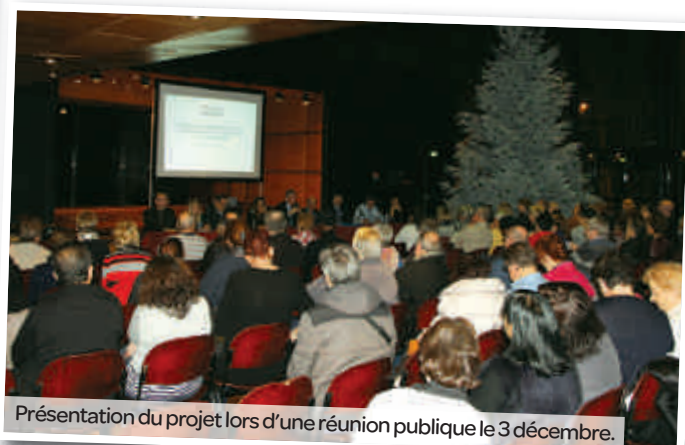
Présentation du projet lors d'une réunion publique le 3 décembre.