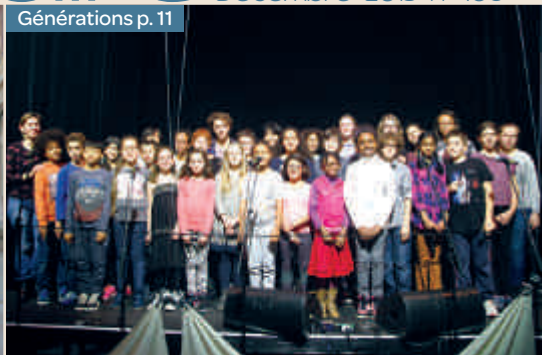
Génération p. 11