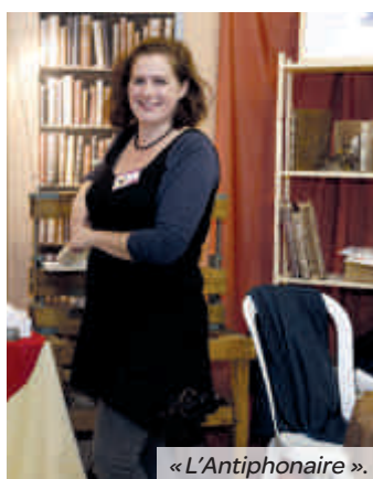
« L'Antiphonaire ».