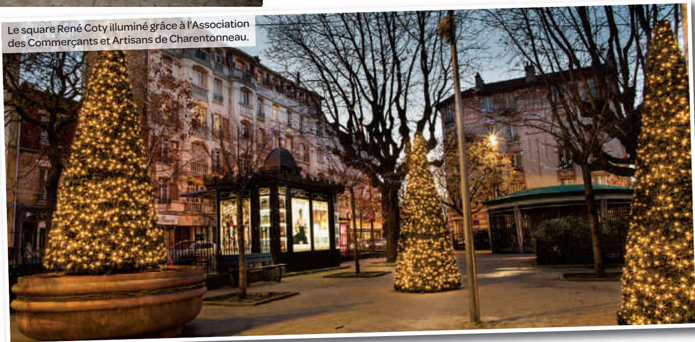
Le square René Coty illuminé grâce à l'Association des Commerçants et Artisans de Charentonneau.