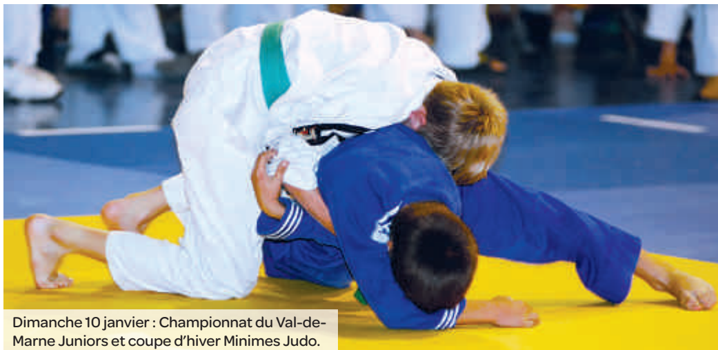
Dimanche 10 janvier : Championnat du Val-de-Marne Juniors et coupe d'hiver Minimes Judo.