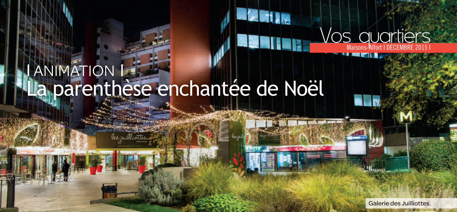
Galerie des Juilliottes.