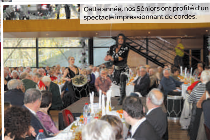
Cette année, nos Séniors ont profité d'un spectacle impressionnant de cordes.

La rédaction du Maisons-Alfort Magazine souhaite à tous les Seniors maisonnaires un Joyeux Noël et une belle année 2016 !