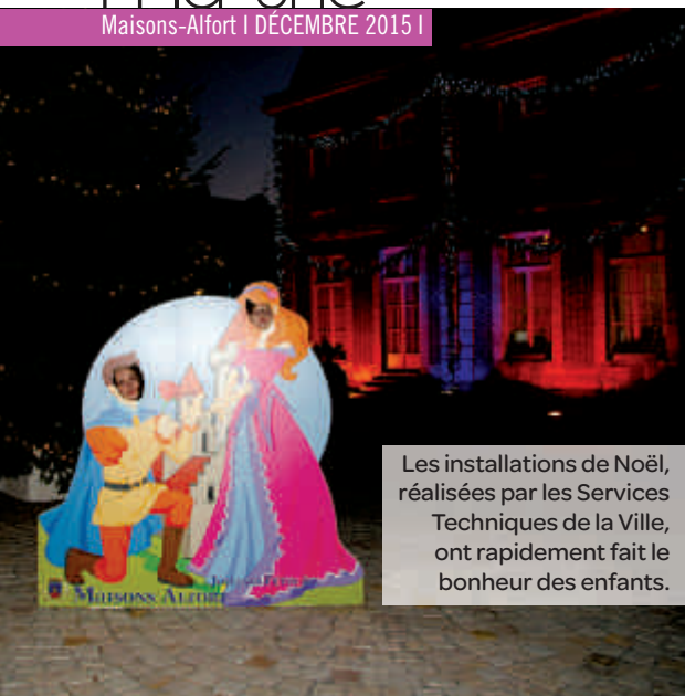
Les installations de Noël, réalisées par les Services Techniques de la Ville, ont rapidement fait le bonheur des enfants.