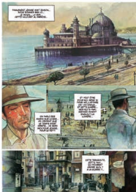
Mogigliani à Nice extrait de « Modigliani, prince de la bohème » (Casterman).