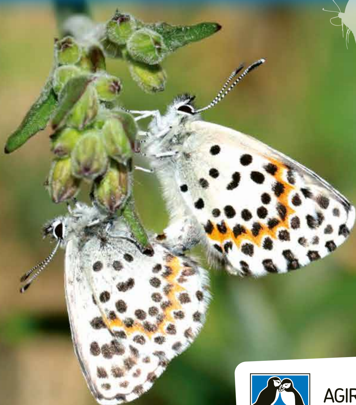
Azuré des orpins

Papillons de jour remarquables en Occitanie Apprenons à mieux les connaître pour mieux les préserver !