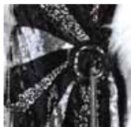
Costume d'Anthony Powell pour le rôle de Lina Lamont dans Singin' in the rain . Comédie musicale mise en scène par Robert Carsen, Théâtre du Châtelet, Paris 2015-2017.

Tous les jours à 10h15 / 12h / 13h45 / 15h30