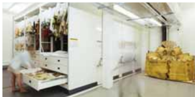
Les réserves du CNCS.

Accès pour visiteurs à mobilité réduite , espaces accessibles en fauteuil roulant, fauteuils disponibles à l'accueil du Musée dans la limite des stocks disponibles (réservation conseillée). Renseignements : mediation@cncs.fr