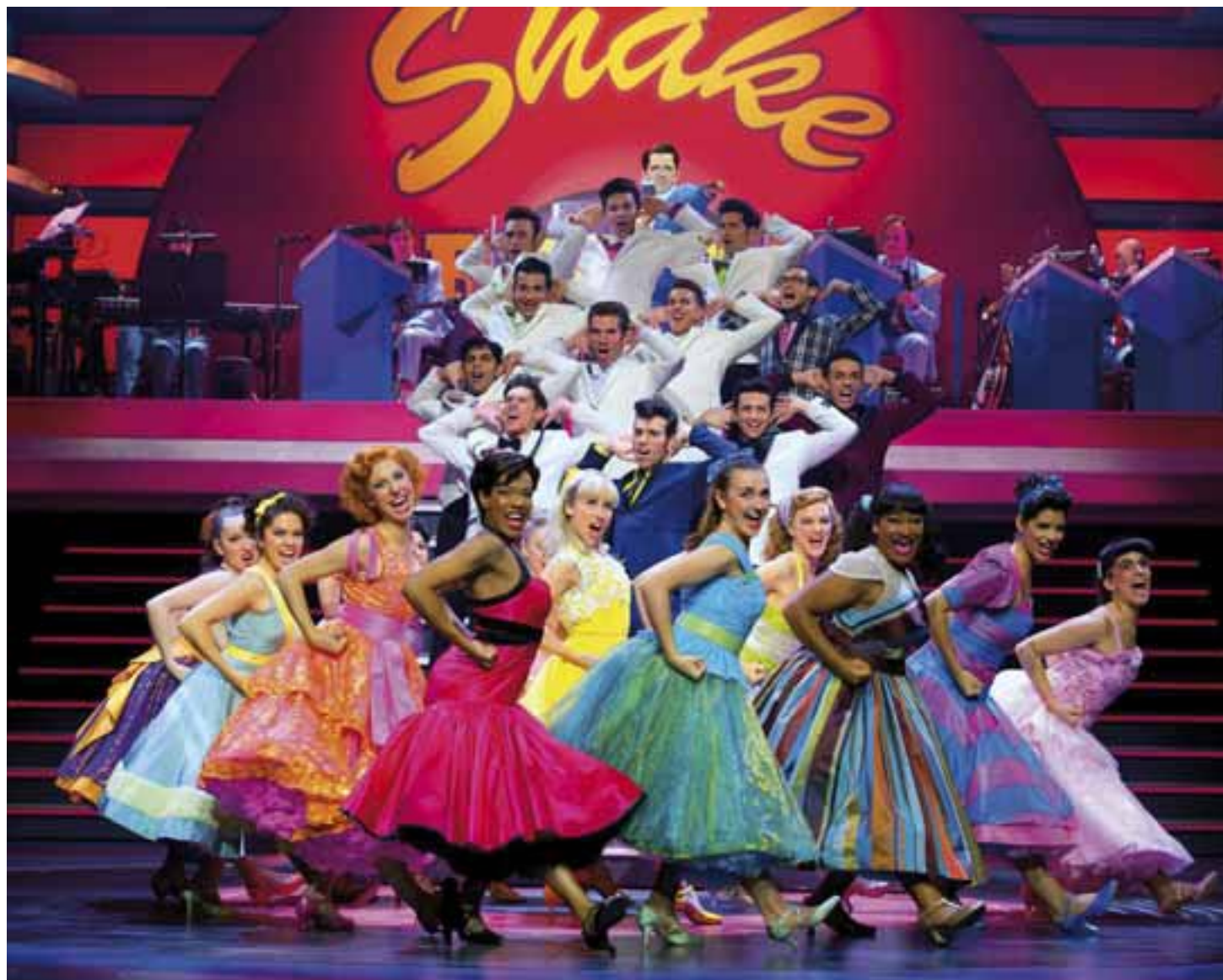
Grease , comédie musicale mise en scène par Martin Michel, costumes d'Arno Bremers, Théâtre Mogador / Stage Entertainment France, Paris, 2017.