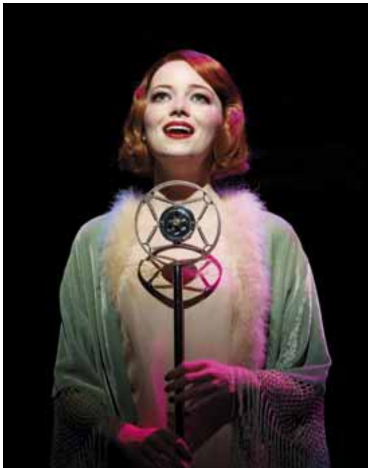
Emma Stone dans le rôle de Sally Bowles. Cabaret, 2014.