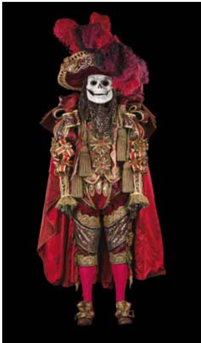
Costume de Maria Björnson pour le rôle du Phantom dans The Phantom of the Opera . Comédie musicale mise en scène par Harold Prince et chorégraphiée par Gillian Lynne, Her Majesty's Theatre, Londres, 1986.

🕒 Jacques Demy (réalisateur) et Michel Legrand (compositeur) / le film musical en France / la mode des années 50/ symbolique des couleurs / Sempé (dessinateur, décorateur) / Vanessa Seward (créatrice de mode, costumière) / Vincent Niclo et Nathalie Dessay / Costumes intemporels