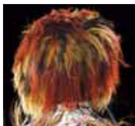
Costume de John Napier pour le rôle de Macavity dans Cats . Comédie musicale mise en scène par Trevor Nunn et chorégraphiée par Gillian Lynne, Winter Garden Theatre, New-York, 1982.