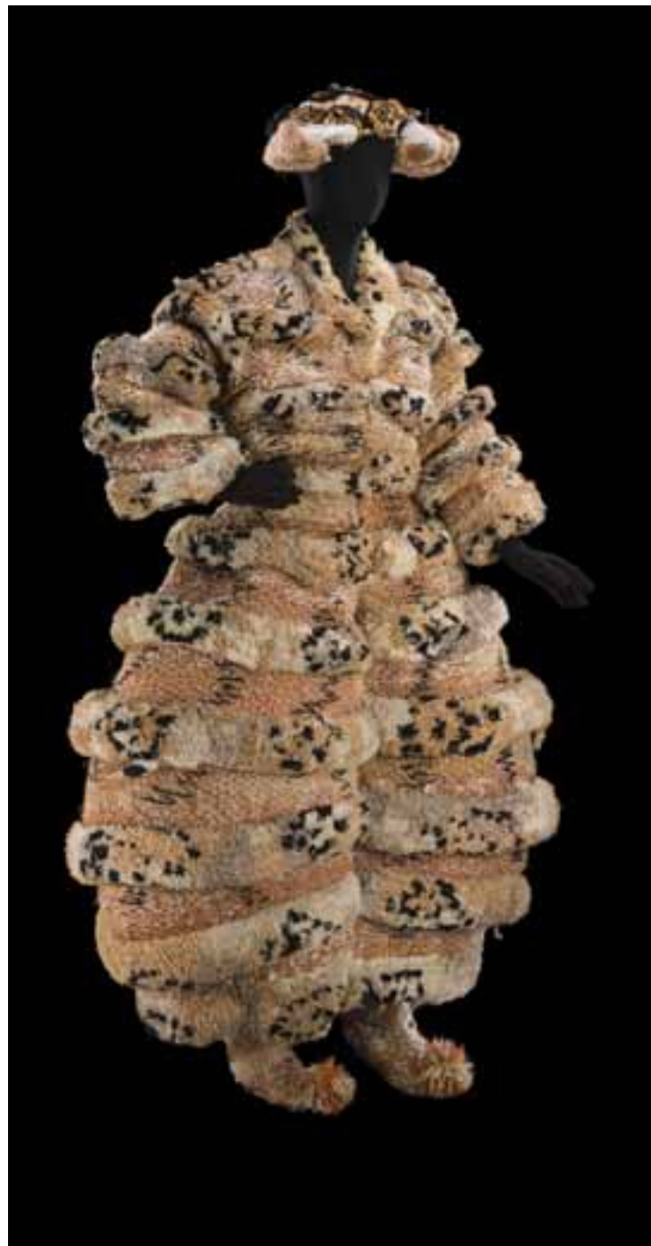
Costume de John Napier pour le rôle de Old Gumbie Cat dans Cats . Comédie musicale mise en scène par Trevor Nunn et chorégraphiée par Gillian Lynne, Winter Garden Theatre, New-York, 1982.

⊙ Film musical L'amour chante et danse (Holiday Inn) , de Mark Sandrich, 1942. / du film musical au musical / Irving Berlin (compositeur) / couleurs et costumes