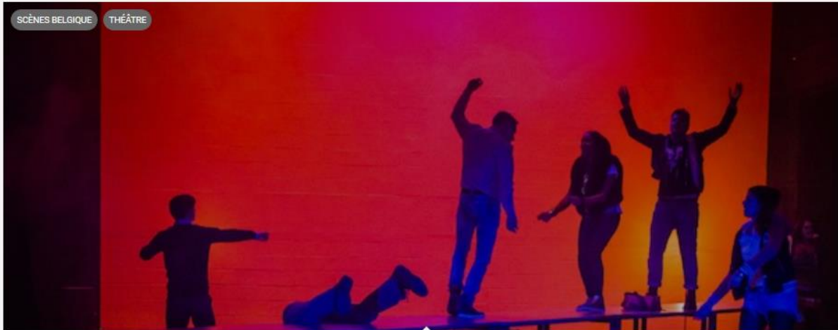
Punk Rock : électron libre et énergie brute

P etit meurtre entre amis... La pièce de Simon Stephens devient presque un laboratoire expérimental pour mettre en scène la violence chez les adolescents. Un huis clos détonnant qui place le public sous tension.