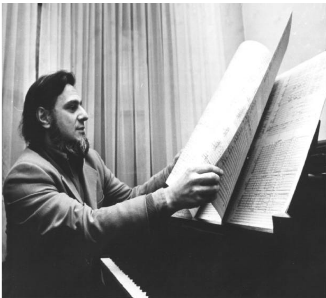
André Prévost devant une de ses oeuvres, 1977.

«Cette oeuvre a été commandée par l'Orchestre symphonique de Québec grâce à une subvention du Conseil des arts du Canada. La première a eu lieu le 6 avril 1976 à Québec par l'Orchestre symphonique de Québec sous la direction d'Otto-Werner Mueller».