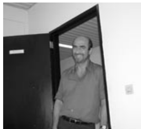
Pierre Herbecq © Archives de RCN