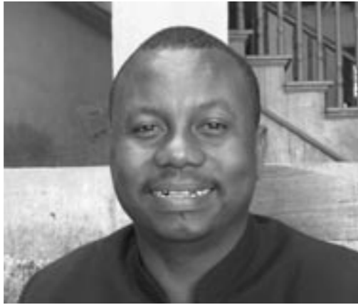
La volonté de construire