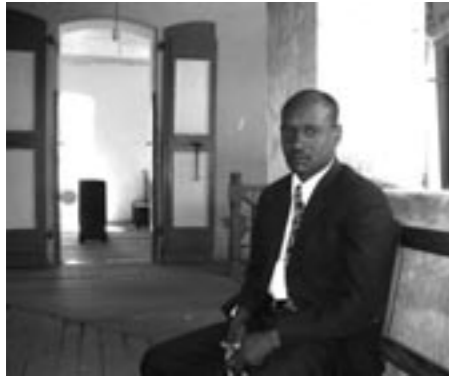
Jean-Claude Théogène, juge à la Cour d'appel du Cap Haïtien, responsable du volet mémoire au BAJ.

« Parler de réforme judiciaire, c'est parler de manière générale de l'adaptation de nos codes, parler aussi de nouveaux moyens à la disposition de nos juges et puis harmoniser les rapports sociaux entre les dirigeants et les dirigés, particulièrement dans le monde judiciaire, entre la police administrative et les autorités judiciaires, donc la magistrature et les membres du Parquet, entre la magistrature et les autres acteurs de la société civile ».