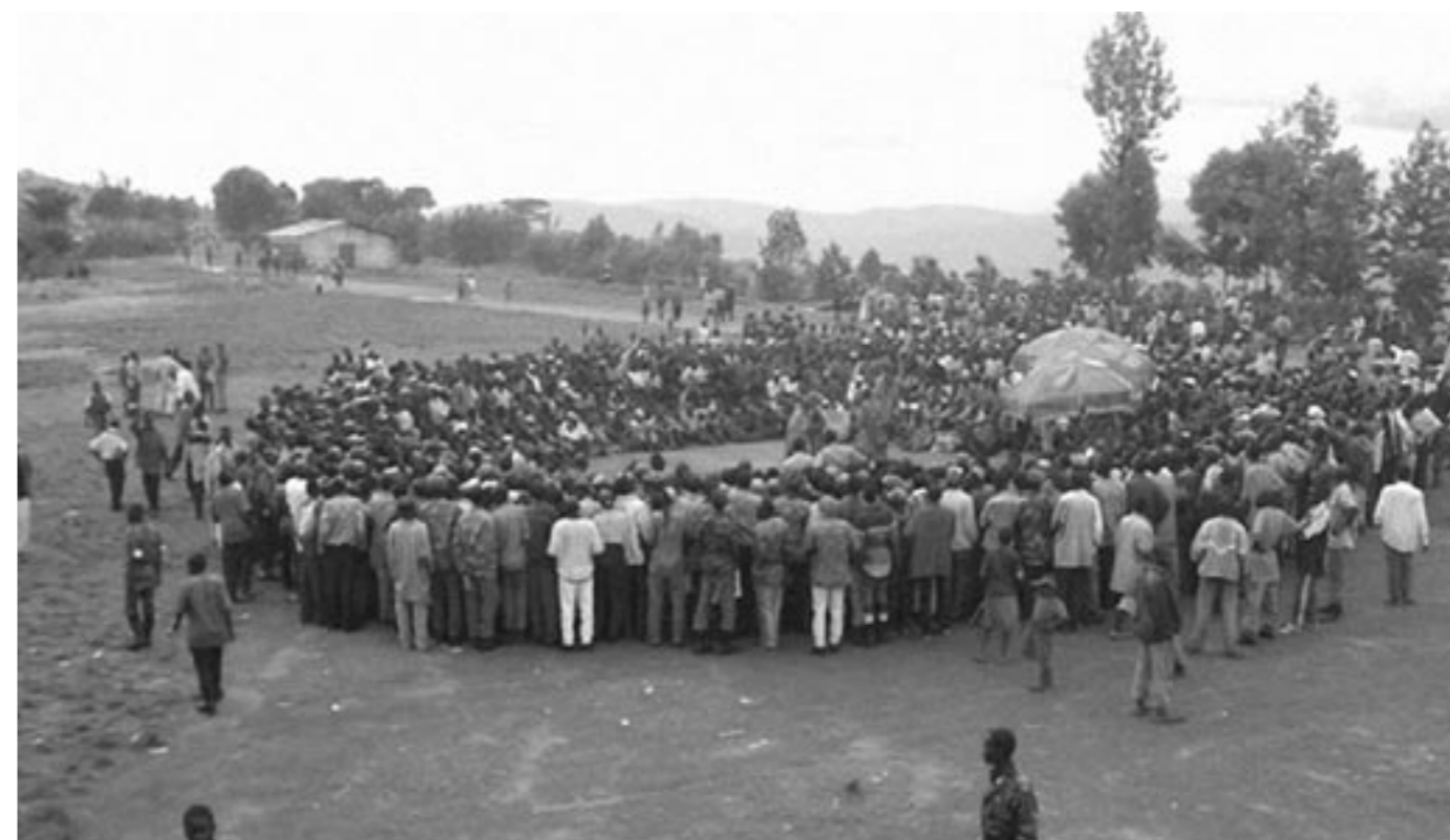
Photo : 3000 personnes assistent au spectacle « Habuze Iki ? ».

RCN, Justice et Démocratie. Extrait du Programme triennal 2003-2005.