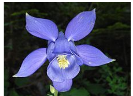
Aquilegia bertolonii (Ancolie de Bertolini).