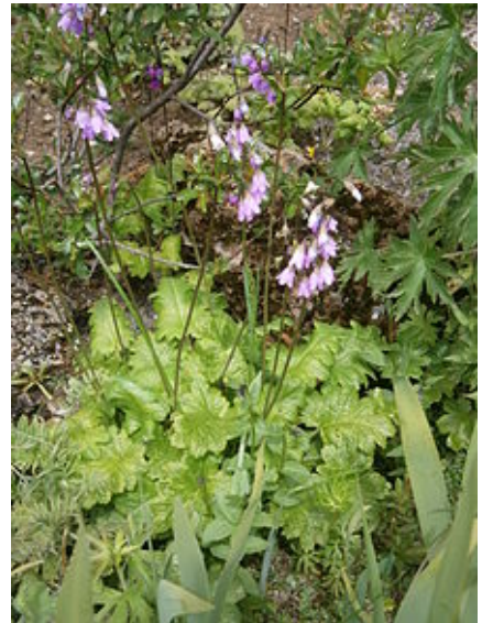
Cortusa matthioli (Cortuse de Matthioli).