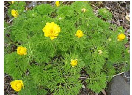
Adonis pyrenaica (Adonis des Pyrénées).