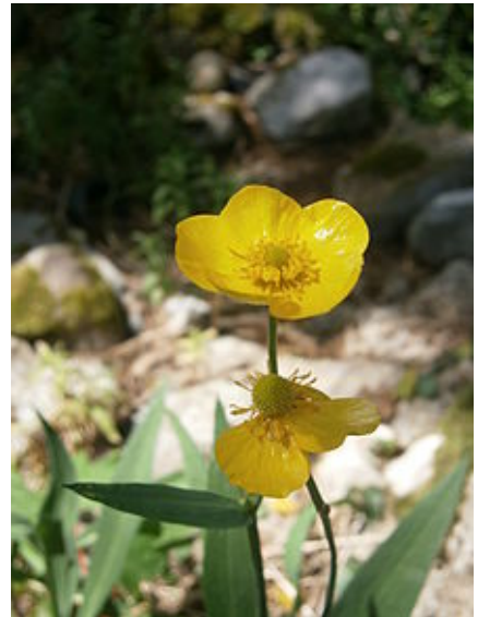
Ranunculus lingua (Grande Douve).