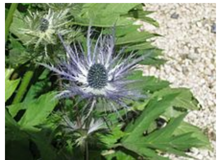
Eryngium alpinum (Panicaut des Alpes, ou chardon bleu des Alpes).