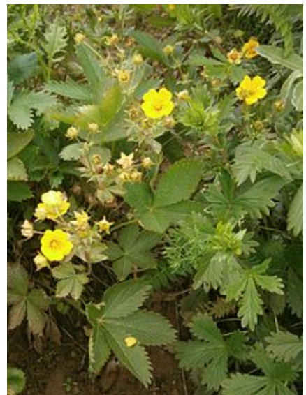
Potentilla delphinensis (Potentille du Dauphiné).