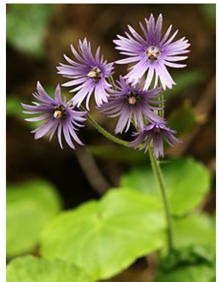
Soldanella villosa (Soldanelle velue).