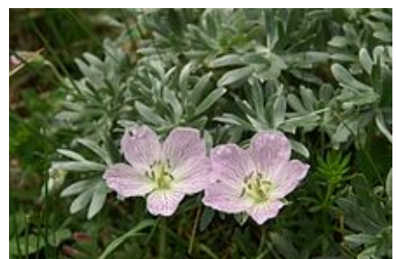
Geranium argenteum (Géranium à feuilles argentées).