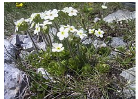
Androsace chamaejasme (Androsace petit jasmin).