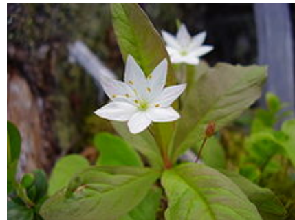
Trientalis europaea (Trientale).