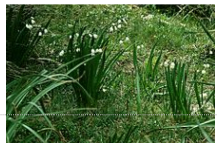
Leucojum aestivum (Nivéole d'été).