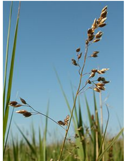
Hierochloa odorata (Avoine odorante).