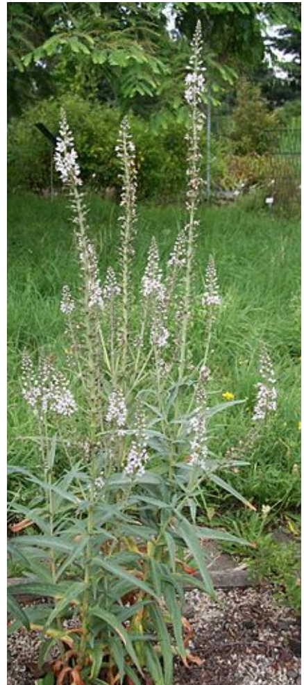
Lysimachia ephemera (Lysimaque à feuille de saule).