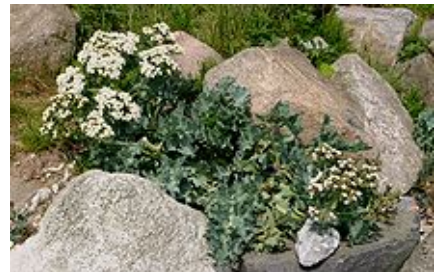
Crambe maritima (Chou marin).