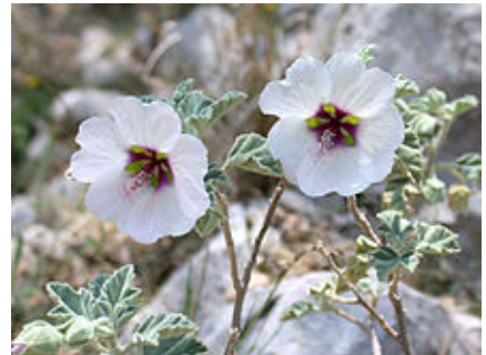
Lavatera maritima (Lavatère maritime).