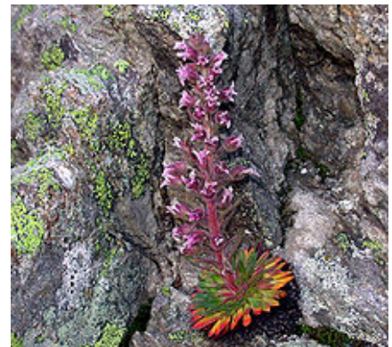
Saxifraga florulenta (Saxifrage à nombreuses fleurs).