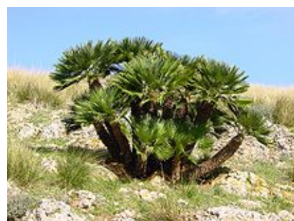
Chamaerops humilis (Palmier nain, Doum).