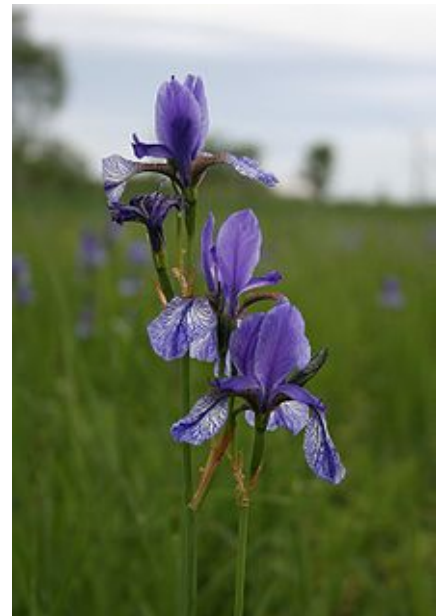
Iris sibirica (Iris de Sibérie).