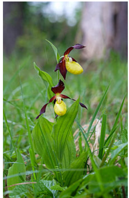
Cypripedium calceolus (Sabot de Vénus).