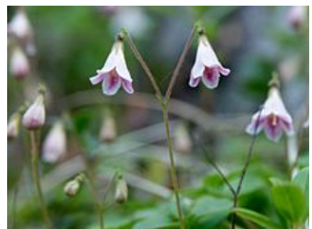
Linnaea borealis (Linnée boréale).