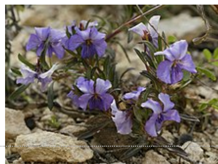
Viola arborescens (Violette ligneuse).