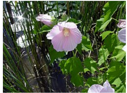
Hibiscus palustris (Rose des marais).