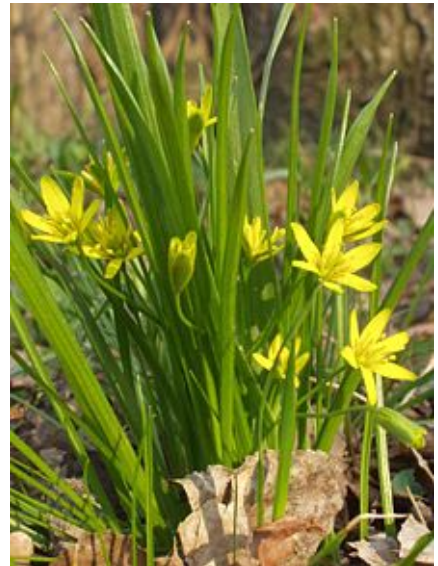
Gagea lutea (Gagée jaune).