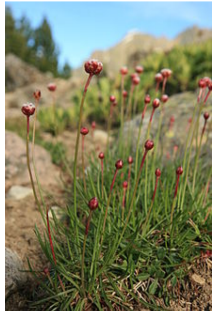
Armeria ruscinonensis (Armeria du Roussillon).