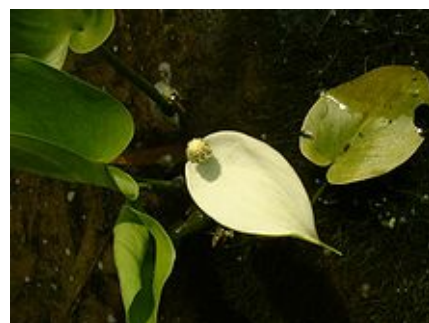
Calla palustris (Arum d'eau).