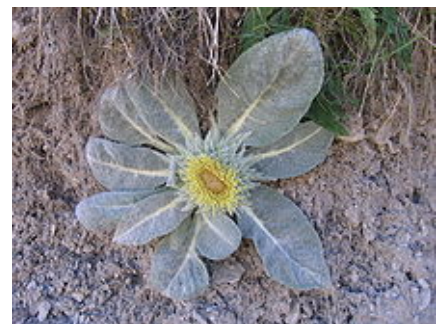
Bérardie laineuse ( Berardia lanuginosa ou Berardia subacaulis ).