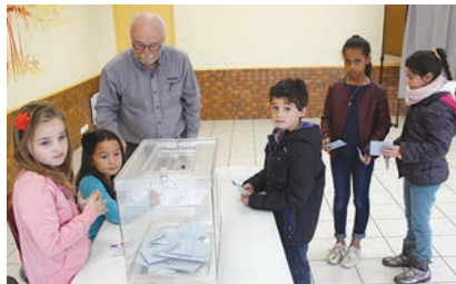
CONSEIL MUNICIPAL ENFANTS 12 nouveaux élus pour 2 années