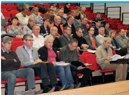
Conseil Communautaire commun - Bignan le 4 mai 2016

Avancer ensemble vers un projet commun et dans la même direction politique est la priorité des élus dans le cadre de cette démarche de fusion. Cette volonté est la garantie d'une gestion territoriale efficace dont l'objectif est d'apporter un service de proximité adapté à l'échelle de la nouvelle intercommunalité. Le territoire de Centre Morbihan Communauté a été pensé en tenant compte de ses spécificités, de ses contraintes mais aussi de ses forces, et bien sur des pratiques et des expériences réussies de chaque Communauté de communes.