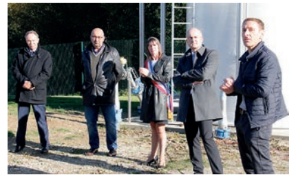
STATION D'ÉPURATION Inauguration avec le Sous-Préfet