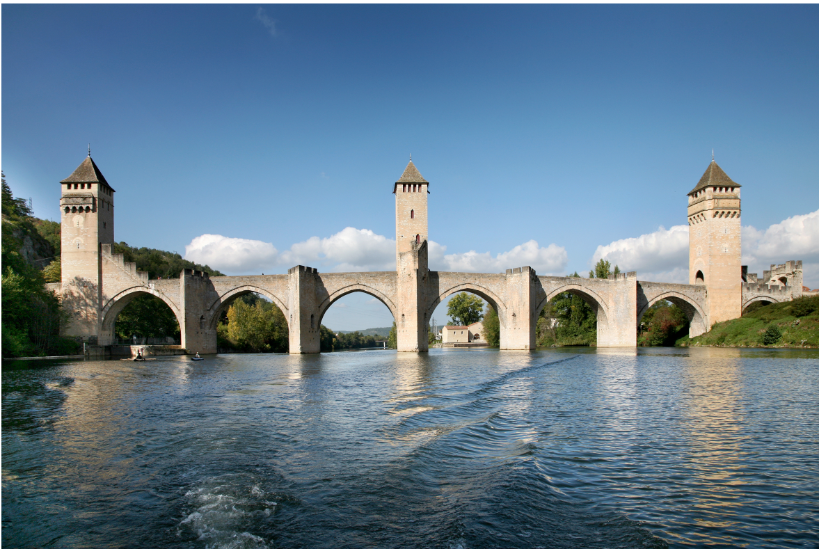
La période médiévale est au coeur de l’identité de Cahors et de l’imaginaire historique de ses vins. “Pont Valentré”. Cahors, 2015