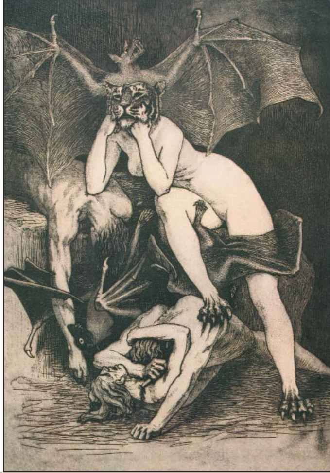
Illustration de Valère Bernard, Musée des Beaux-Arts de Marseille