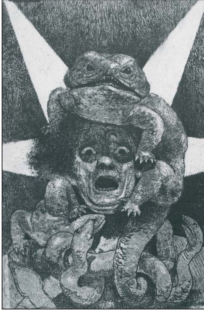
Illustration de Valère Bernard, Musée des Beaux-Arts de Marseille