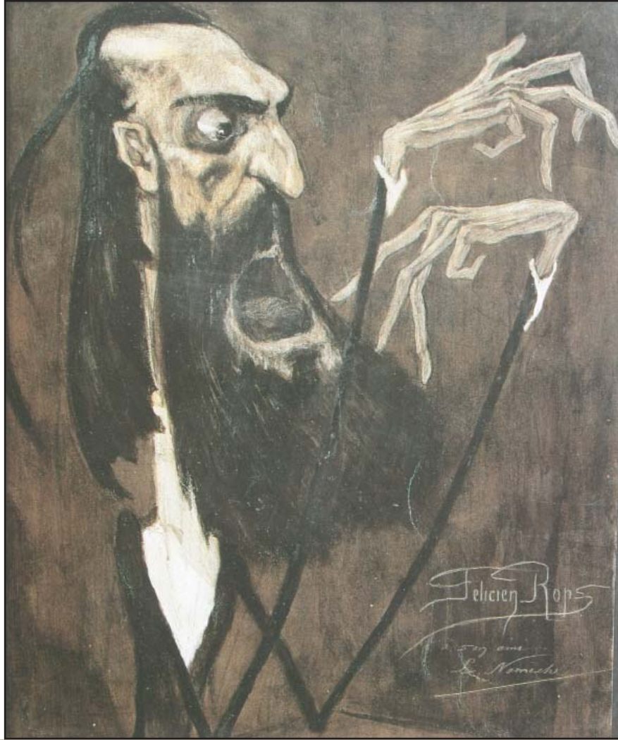
Illustration de Félicien Rops, Crédit Communal de Belgique