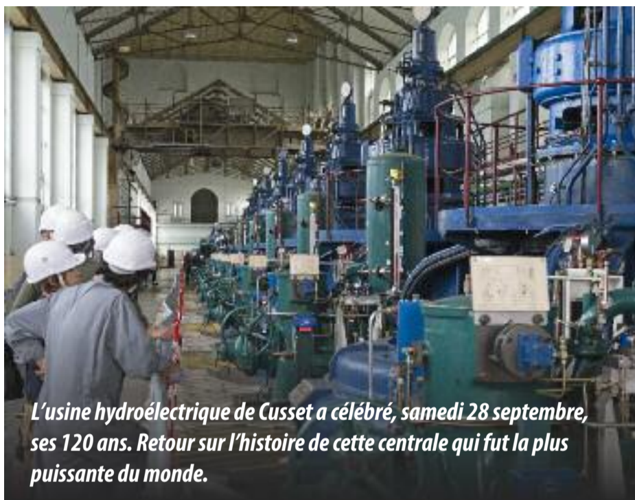
L'usine hydroélectrique de Cusset a célébré, samedi 28 septembre, ses 120 ans. Retour sur l'histoire de cette centrale qui fut la plus puissante du monde.

L'aventure humaine peut alors commencer. À partir de 1894, plus de 3 000 hommes s'attellent, à la force de leurs bras, au creusement des 19 kilomètres du canal de Jonage, de jour comme de nuit. C'est douze fois plus d'ouvriers que pour la construction de la tour Eiffel. Une véritable petite cité de baraquements est aménagée pour les accueillir. On doit d'ailleurs aux femmes de certains d'entre eux la naissance des guinguettes des bords de Rize. Il faudra quatre ans et des litres de sueurs, de larmes et de sang à cette armée de pioches pour achever le travail colossal. Quatre ans à lutter contre les caprices du Rhône, à endurer