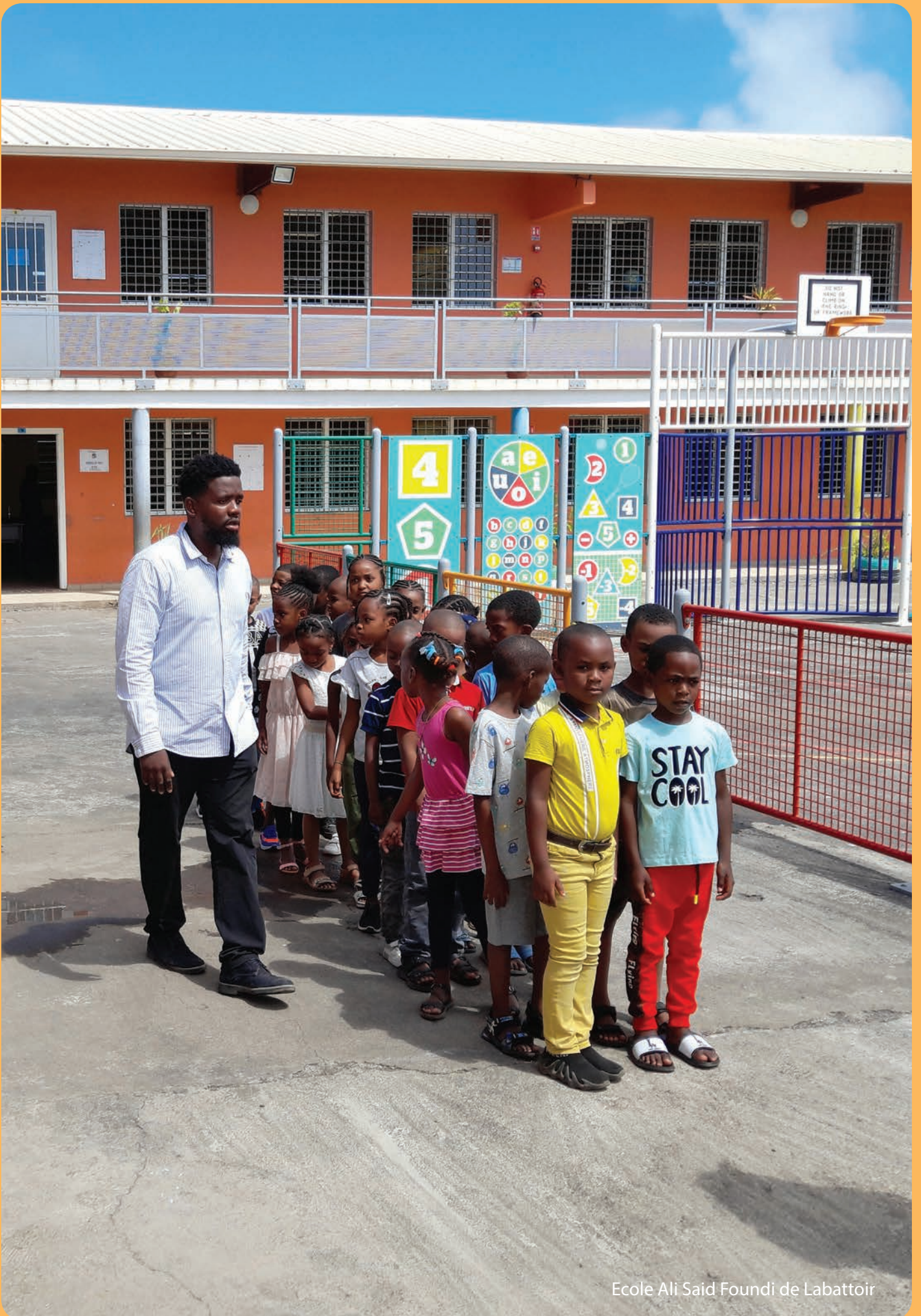
Ecole Ali Said Foundi de Labattoir