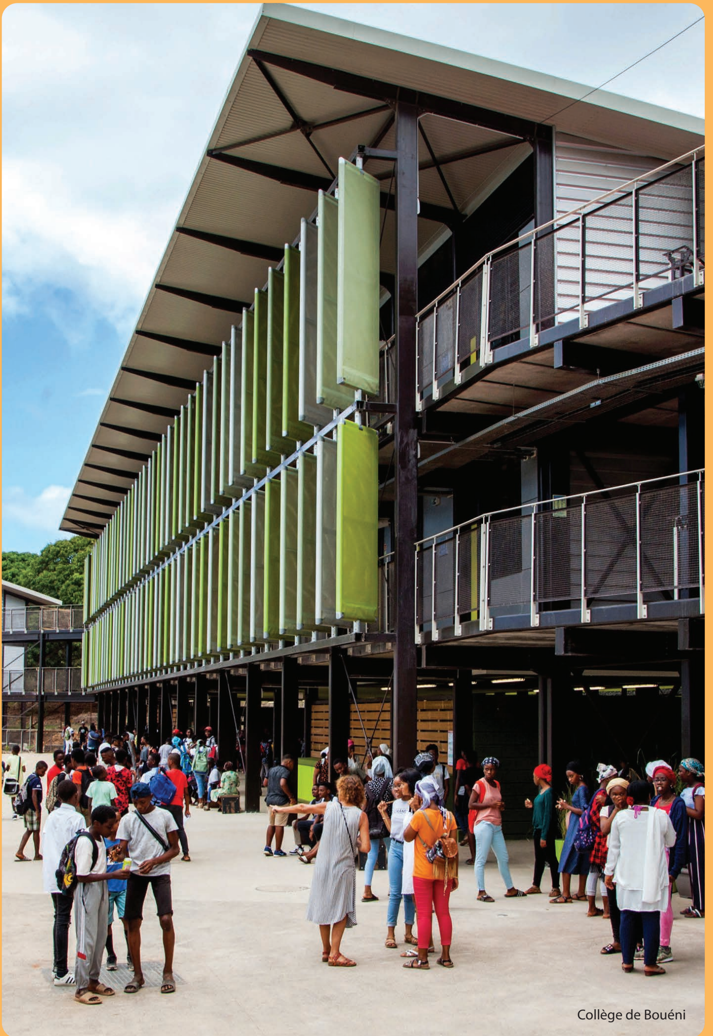
Collège de Bouéni