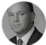
Mark Simmonds Ex FCO - Ministre britannique pour l'Afrique