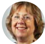
Rt Hon Baroness Northover

Chef de la recherche économique Ecobank, Afrique subsaharienne