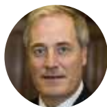
Rt Hon Lord Bates Ministre d'État Département britannique pour le développement international