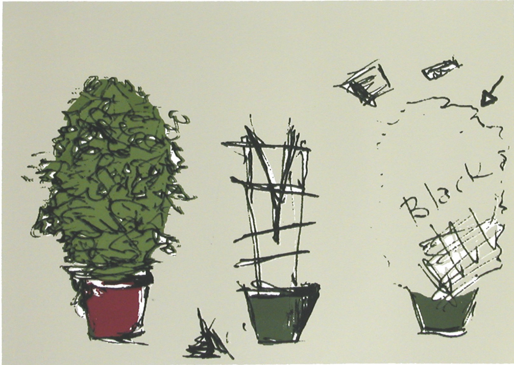
Jean-Pierre Gilbert, Traité d'écologie contemporaine , 2007, sérigraphie sur papier BFK Rives. Édition de 12 exemplaires. Comprends 11 planches-images et 6 planches textes de l'auteur sous emboîtement de bois, 51 x 66 cm