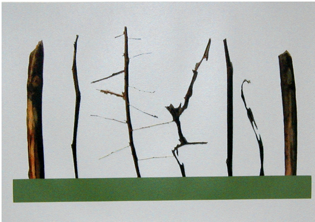
Jean-Pierre Gilbert, Traité d'écologie contemporaine , 2007, sérigraphie sur papier BFK Rives. Édition de 12 exemplaires. Comprends 11 planches-images et 6 planches textes de l'auteur sous emboîtement de bois, 51 x 66 cm

Les enfants et les adultes sont invités à collaborer à l'ornementation du projet « Nature à colorier » (les crayons de couleur sont fournis).