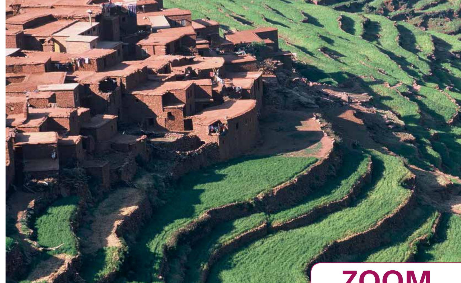
Le Haut-Atlas - Photo François Virot extrait de l'exposition «Le Maroc Berbère»