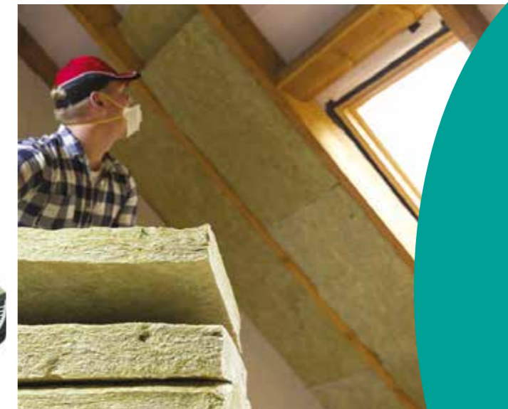
Isolation du toit