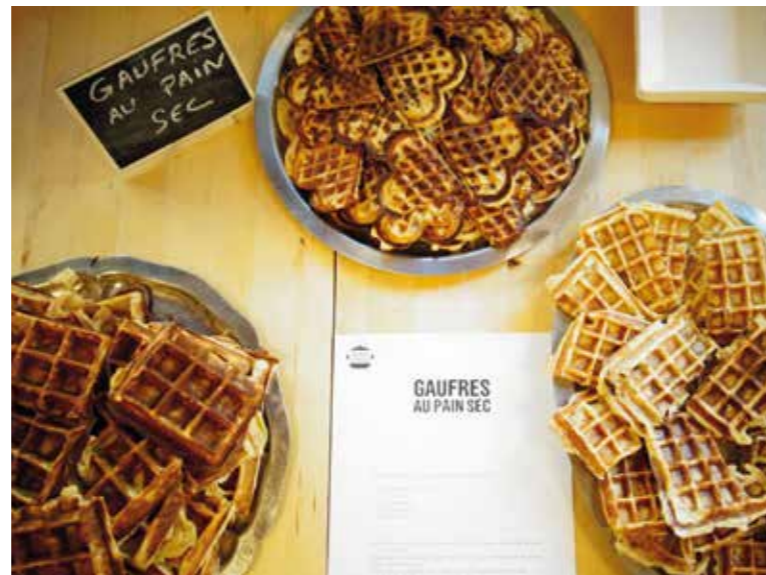
La gaufre au pain sec.