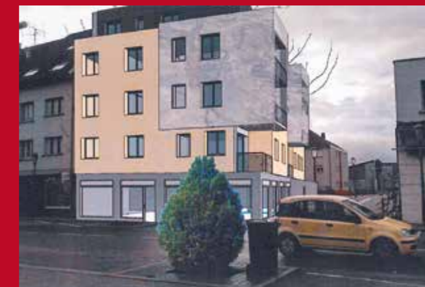
Vue d'architecte de la future construction