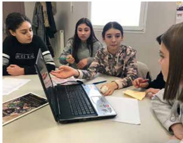
Réunion du nouveau CMJ

Lundi 16 décembre 2019, la séance du conseil municipal – des adultes- bat son plein. Dans l'ombre, 15 collégiens, prêts à être présentés à leurs aînés. Stressés, émus mais surtout fiers, ils n'attendent qu'une seule chose : pouvoir exprimer leurs idées. Après leur investiture officielle, ils arborent leur écharpe tricolore, ça y est ils y sont enfin : les voilà jeunes élus de la République. Ils ont entre 13 et 14 ans et habitent Audincourt. Ils partagent tous une même conviction : faire bouger la vie de leur quartier voire de la ville. « Il n'y a rien de plus concret pour une ville que l'éducation à la citoyenneté. La citoyenneté ne commence pas qu'à 18 ans avec le droit de vote. Le conseil municipal junior se veut pédagogique, ludique mais surtout efficace » déclare Marie-Claude Gallard, maire. « Nous, adultes, nous sommes à leur écoute et à leur disposition pour la mise en place de projets constructifs » . Et des projets, il y en a eu ces dernières années. Semih, ancien conseiller junior est fier de faire le bilan de son mandat « notre travail a été plusieurs fois récompensé, j'espère que nos successeurs continueront sur cette lancée » . Le message est passé, en avant toute !