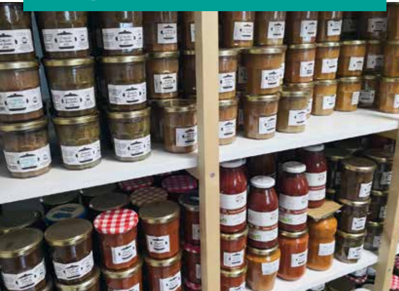
Compotes, confitures et coulis réalisés par Récup'et gamelles