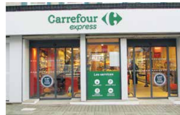
Exemple d'un Carrefour Express