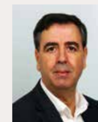
Kamel REBAI Politique de la ville, cohésion sociale, jeunesse, logement droits des citoyens