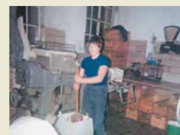
> intérieur de la laiterie en 1968