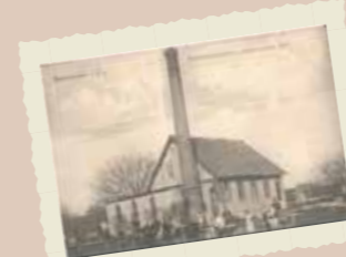
> Coopérative laitière en 1902