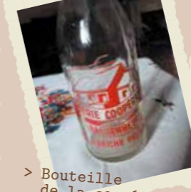
> Bouteille de la coopérative 1960