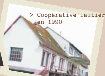
> Coopérative laitière en 1990

Comme dans beaucoup de communes alsaciennes, un mouvement coopératif important se développe à Baldenheim à la fin du XIXe siècle. Une Caisse d'épargne est alors créée, ainsi qu'une coopérative d'élevage porcin et surtout une coopérative laitière.