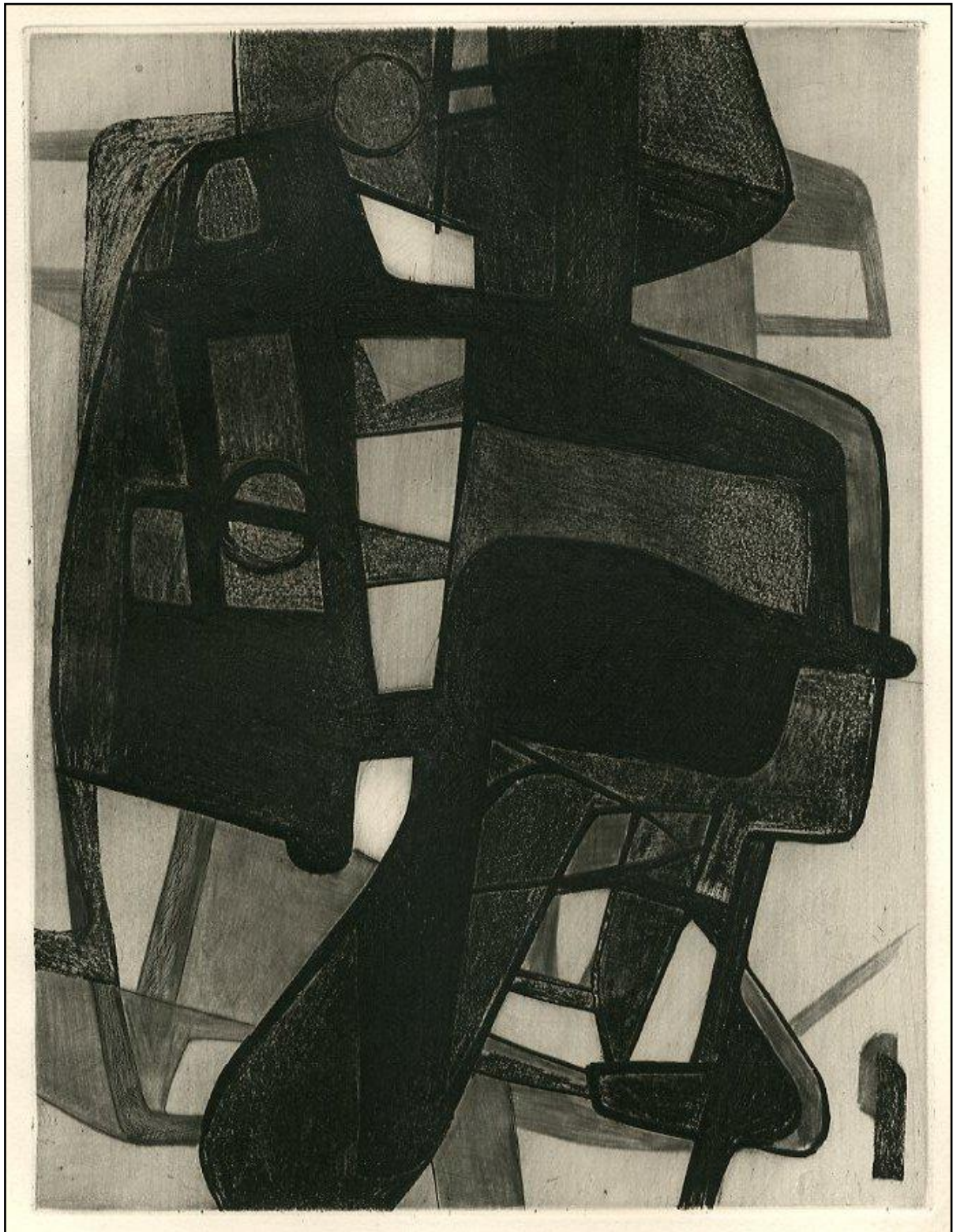
N° 804 : André Frénaud. Tombeau de mon père. Eaux-fortes originales de Maurice Estève.