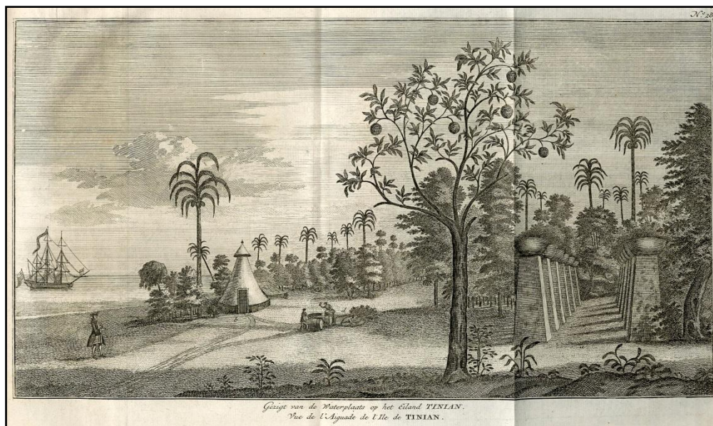
N° 3 : Georges Anson, Voyage autour du monde, fait dans les années MDCCXL, I, II, III, IV.

Les ordres d'achat doivent nous parvenir, au plus tard, le jeudi 13 décembre avant 18 h. Merci de votre compréhension.