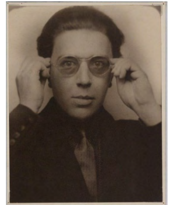
André Breton en 1924

En ce cinquantenaire de la mort d'André Breton, la Bibliothèque nationale de France propose cette bibliographie sélective, qui recense des ouvrages disponibles en accès libre dans les salles H de la bibliothèque du Haut-de-jardin et V de la Bibliothèque de recherche (niveau Rez-de-jardin), des enregistrements et des ressources en ligne.