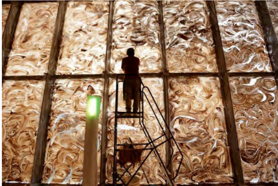
« Le Grand Verre de terre - Vidre de meravelles » à la Bibliothèque nationale de France / Miquel Barceló

Miquel Barceló, peintre, sculpteur, céramiste, graveur, artiste de l'installation et de la performance est né sur l'île de Majorque, en Espagne, en 1957. Aujourd'hui, il vit et travaille à Paris et à Majorque. Il a grandi dans un environnement de falaises, de grottes et au voisinage de la mer. Ainsi, le monde sous-marin, exploré grâce à la plongée, peuple son imaginaire. De plus, les falaises du pays Dogon au Mali où il a vécu et les grottes préhistoriques telles que la grotte Chauvet qu'il a étudiée ont nourri ses œuvres en écho aux paysages et aux interrogations de son enfance. Miquel Barceló est un homme de la matière, il aime être aux prises avec elle et emploie une grande diversité de matériaux et de techniques.