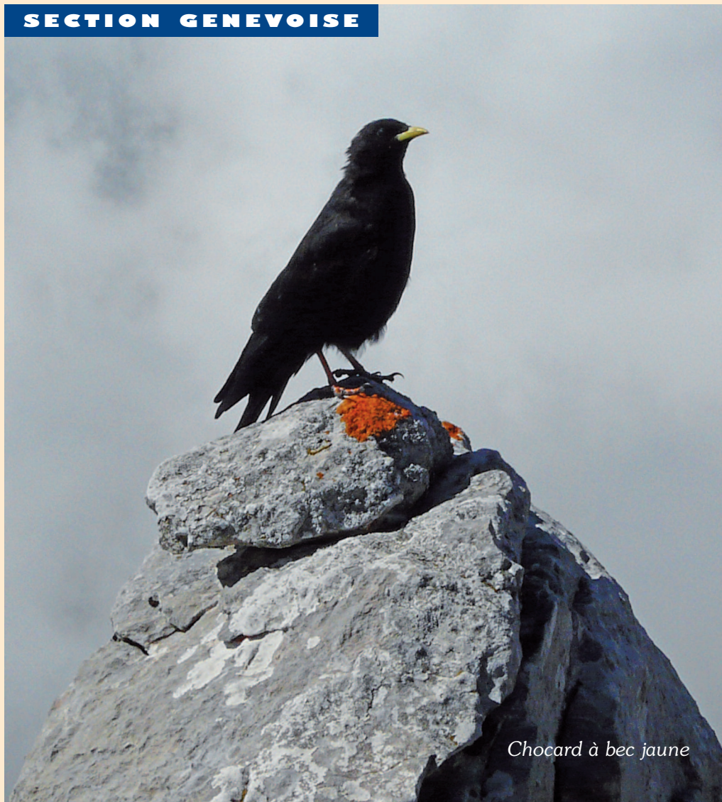
Chocard à bec jaune