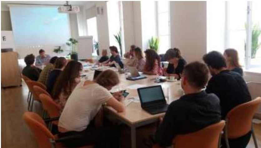
Journée d'étude (23/5/2018) Debating the Norms of Scientific Writing