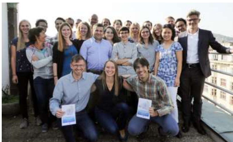
Participants du colloque international Futurs porcins 1. Re-négocier le "sauvage" dans un monde plus qu'humain