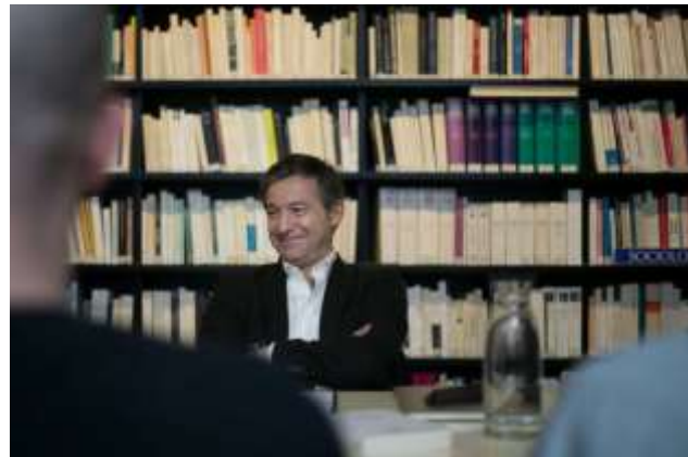
Séminaire informel autour de Didier Fassin (31/10/2018)