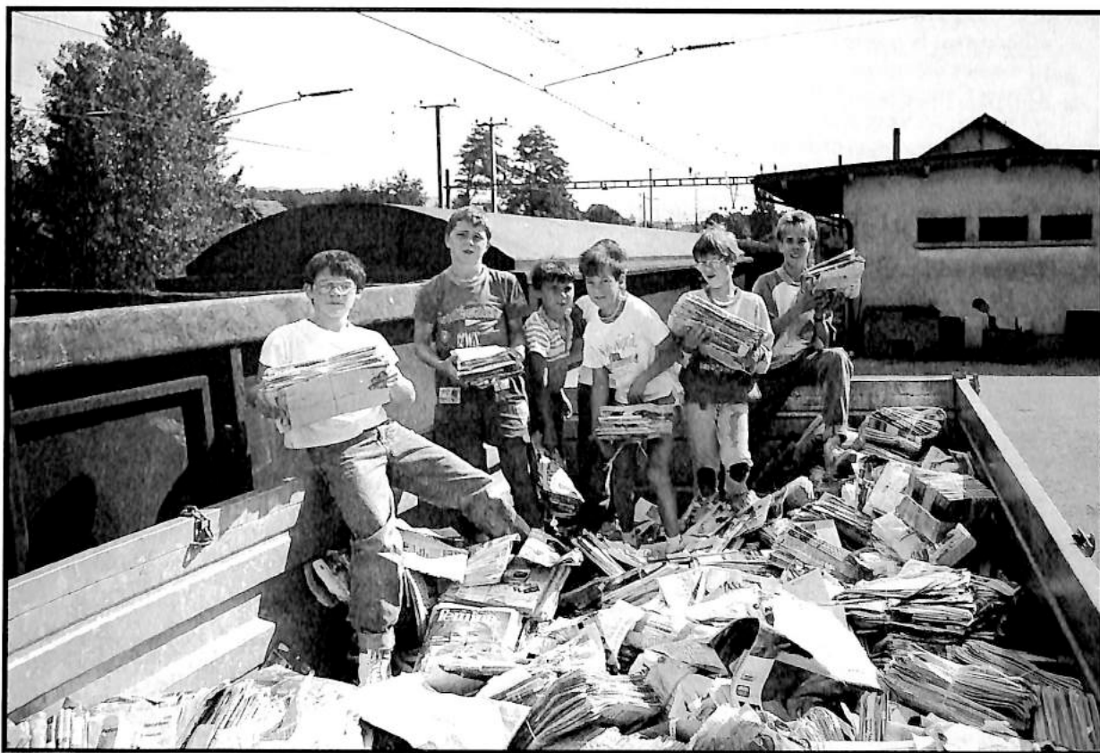
Ramassage de papier à Boudry