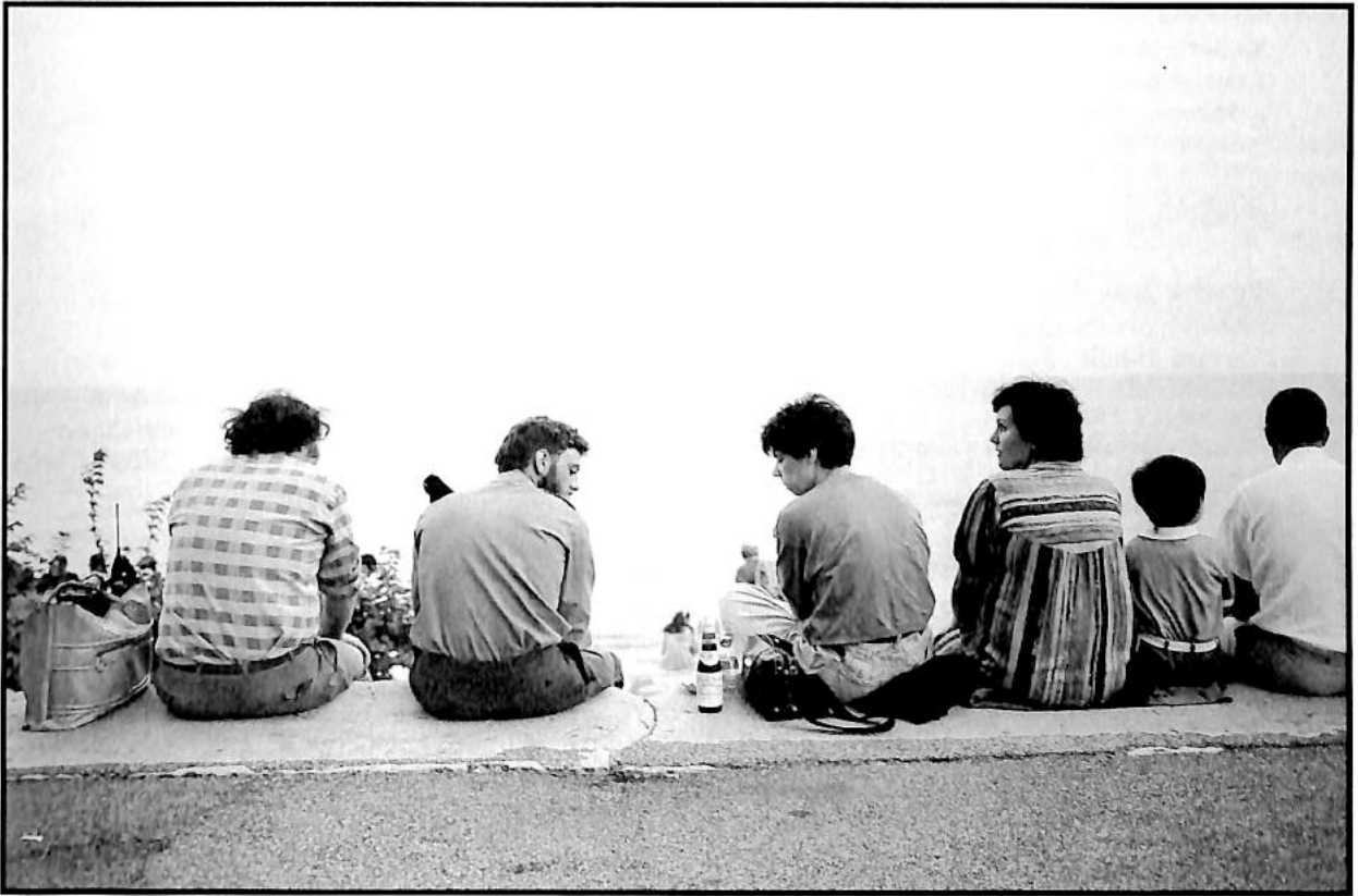
Neuchâtel, quai Ostervald