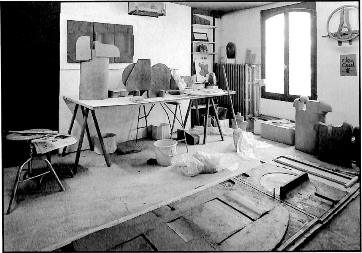
Atelier d'artiste à Neuchâtel