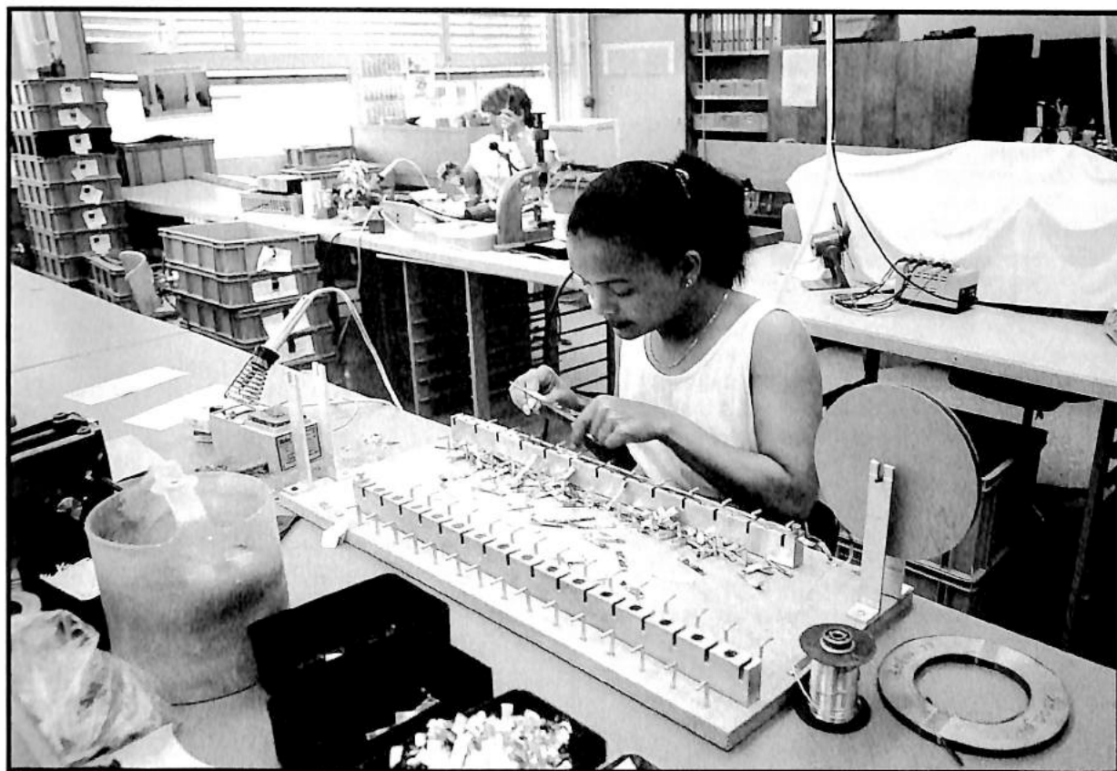
Ouvrière à Boudry