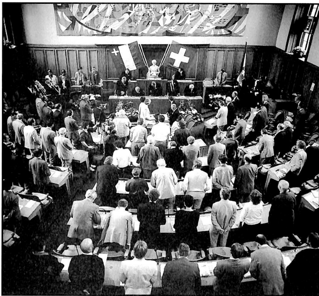
12 septembre 1989: séance du Grand Conseil neuchâtelois, à l'occasion de la commémoration de l'entrée de Neuchâtel dans la Confédération, le 12 septembre 1814