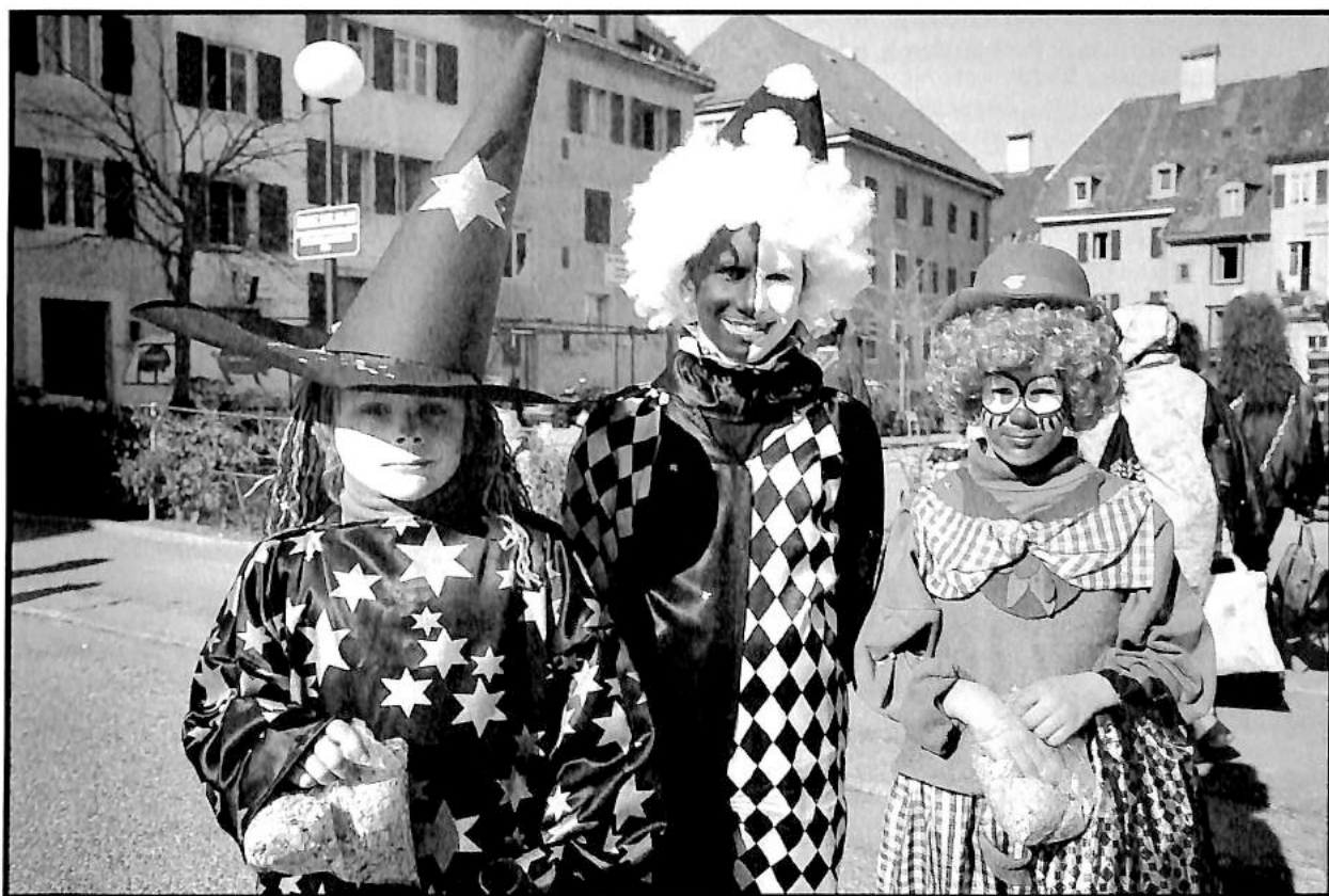
Carnaval à La Chaux-de-Fonds