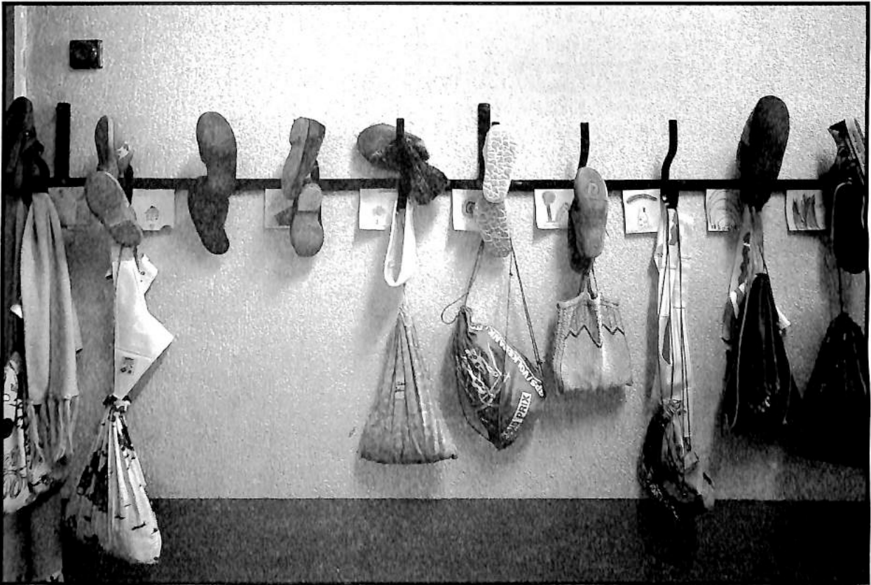
Collège à Dombresson