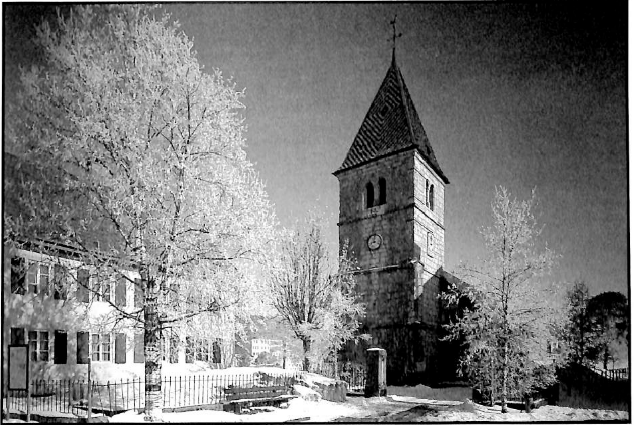
Eglise de La Brévine