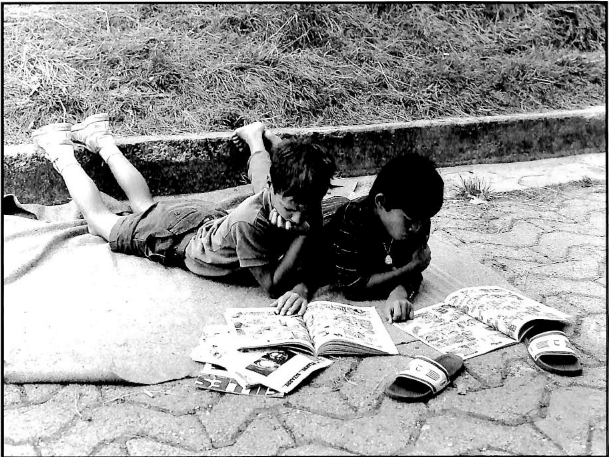
Colonie de vacances à La Côte-aux-Fées