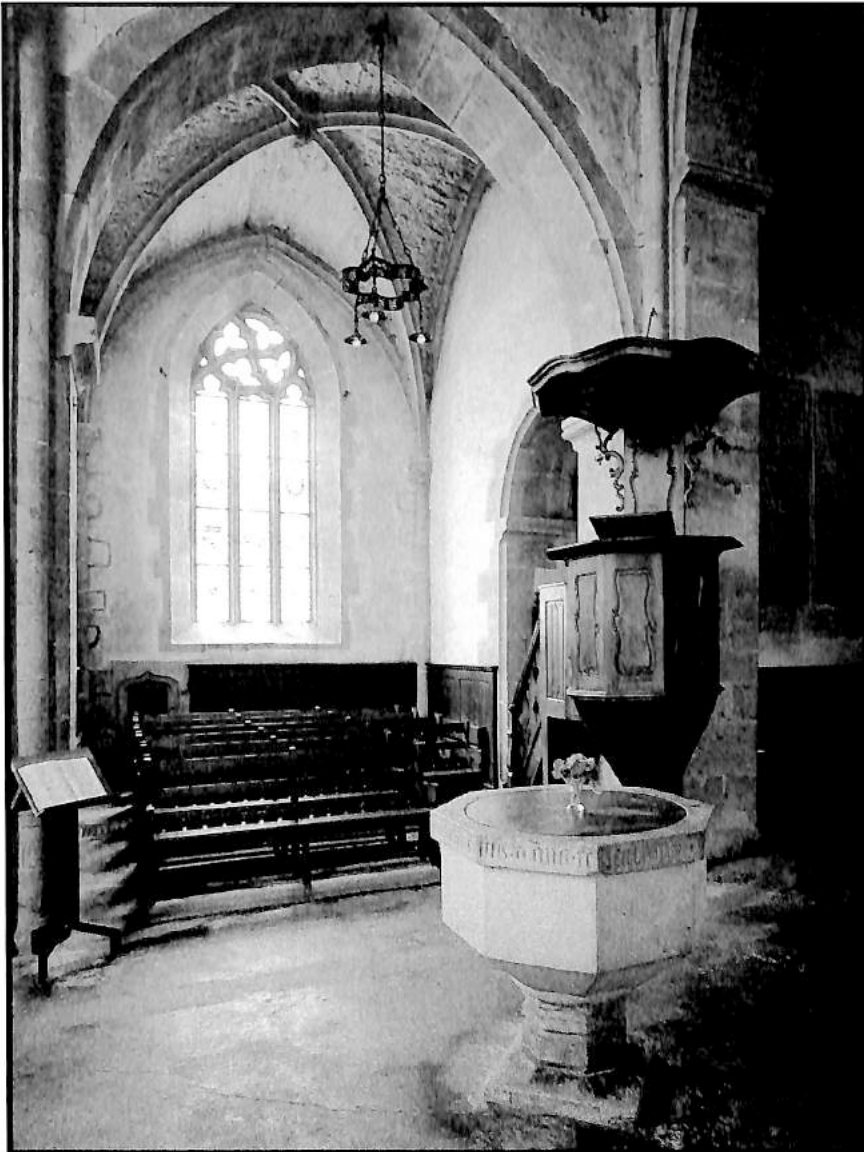
Eglise de Valangin